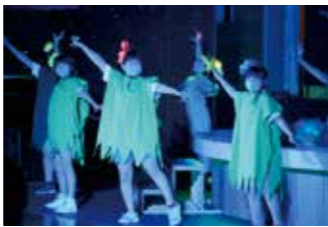
エイリアンになりきって。

10月23日、体育館のステージに舞台が設置され、オペラ「助けて、助けて、宇宙人がやってきた」が、藤原歌劇団によって演じられました。これは文化庁主催「文化芸術による子供育成総合事業（巡回公演）」を活用したものです。