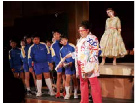
オペラに出演しました。

ライトが消え、一瞬の暗闇に思わずざわさわわ。子どもたちは姿勢を正したり、前のめりになったり物語に引き込まれていきます。音響はピアノとバイオリンの生演奏。体中に付けた電飾をピカピカさせ