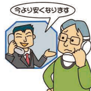
消費者庁イラスト集より

通信販売にはクーリング・オフ制度はありません。解約や返品などは、事業者が定めた利用規約(返品特約)に従うことになります。定期購入だとは思わなかった「飲んでも効かない」からと一方的に受取拒否