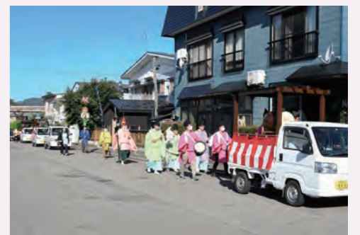
9月としては珍しい猛暑の中、神明社のみこしが角館町内を巡行しました。