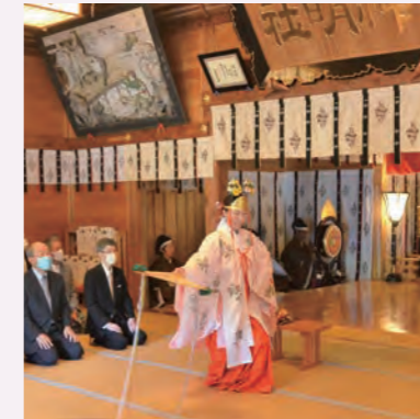
神明社で行われた当日祭。