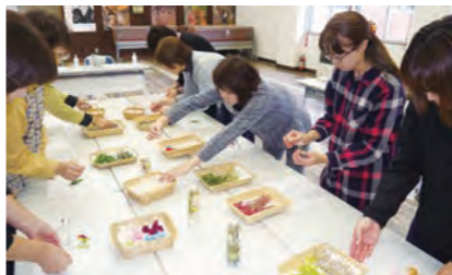
昨年の体験教室の様子。多種多様なドライフラワーを小瓶の中に飾りつけていきます。