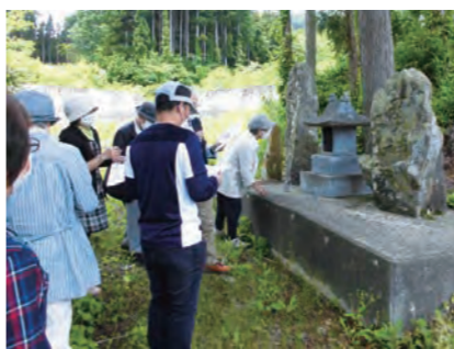
6月に開催した講座の様子。