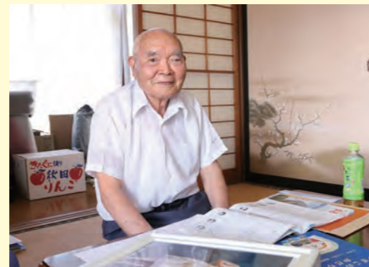
作詞への思いを熱く語ってくれました。

300編くらいかな」と、作品の一部を見せてもらうと情景や思いを表現するために言葉の一つひとつが丁寧に選ばれ、その言葉の引き出しの多さに驚きました。