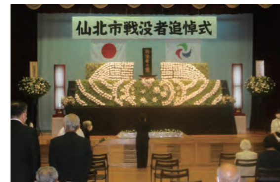
不戦の誓いを新たにしました。