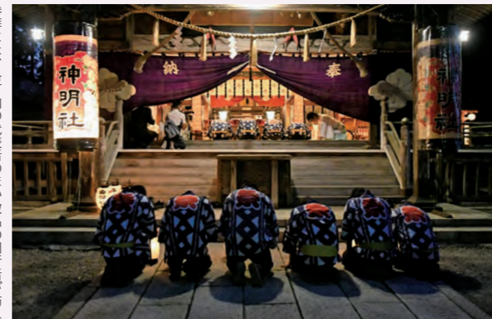
参拝には、各丁内の代表者のほか数名の同行者が訪れました。写真は神明社の参拝の様子。

9月7日から9日は、お囃子が聞こえ、太鼓の音が鳴り響き熱気に包まれるはずだった角館のお祭り。今年は、新型コロナウイルス感染症の収束と来年の開催を願いながら静かにその3日間が終わりました。