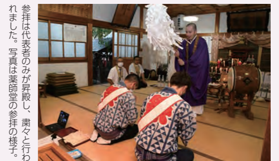
参拝は代表者のみが見舞い、粛々と行われました。写真は薬師堂の参拝の様子。