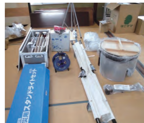
救助工具箱や四つ折り担架、移動かまどなど導入した防災資機材。