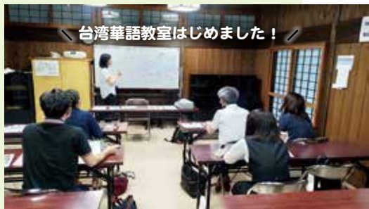
台湾華語教室の様子。