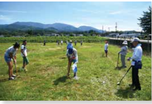
白岩小学校のグラウンドには6ホールのコースが設置されました。

参加した児童からは「ホールに入れるのが難しかったけど、とても楽しかった」などの声が聞かれました。仙北市教育委員会が主催するこの交流事業は、8月から9月にわたって市内の六つの小学校を会場に行われます。