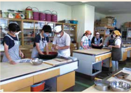
親子そば打ち教室の様子。道具の使い方や力の加減などを聞きながら作っていました。

当日は、5組の親子が初めてそば打ちに挑戦。ふれたことのない道具に苦戦しながらも、先生方から一つひとつの工程について熱心に指導を受けていました。最後には、自分たちで打ったそばができて喜びの姿が見られました。また、午後からは毎月1回恒例のそば打ち教室も開かれ、先生方からアドバイスをもらいながら自分の打ったそばを完成させていました。