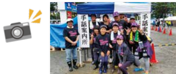
田沢湖マラソンでの活動の様子。

傾聴活動 集いの場「かだれ」の代表として、参加者それぞれが自由な時間を共有できる場づくりや、悩みごとに耳を傾けるボランティア活動。また、仙北手話サークル「こだち」の代表として、手話の練習や交流活動を行っています。