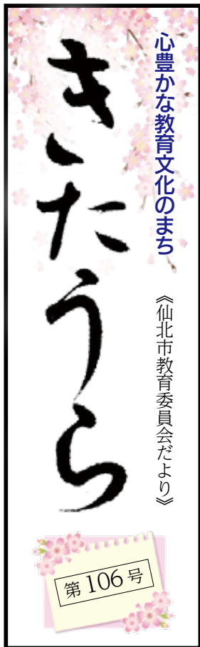
心豊かな教育文化のまち 《仙北市教育委員会だより》

新たな道程が始まるつもりです。新たな道程には新たな分岐点がいくつも生まれます。そのすべてに正しい選択を繰り返し、何としても市民の健やかな日常を守りたいと思います。