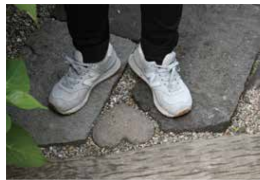
お寺の中に隠されたハート形の石。

蔵さんを見つけてください」というミッションが課せられます。素敵なアジサイばかり取り上げられますが、私のように普段から花を愛でることのない人間からしてみれば、何枚か写真を撮れば満足です。しかし、ミッションがあるので、隠れたハートロックやお地蔵探しに私は夢中になり、気づけばかなりの滞在時間を過ごしていました。「ハートロックやお地蔵を探す」という(1)明確な目標を与えられ、(2)実現可能な難易度に設定されており、(3)見つけた時の成功体験もすぐ与えられます。 仙北市も美しい景色で溢れています（私が一番感動しているという自負があります）。ただ、見て終わりでは完結している節があるのも否めません。大胆な改革や真新しいコンテンツが必要なのではなく、もしかしたらハートロックやお地蔵といった「小さな仕掛け」を施すだけでも、観光の満足度というのはまた一つ変わるのではないのでしょうか。私も早速実践します！