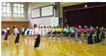
声高らかに、エール!

中止された全県総体を受け、延期していた都市総体が7月11日~12日に行われました。