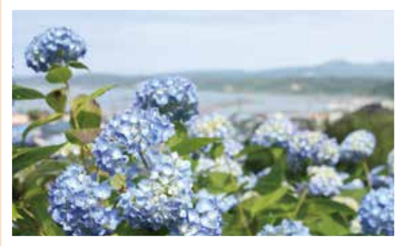
男鹿市・雲昌寺のアジサイ。