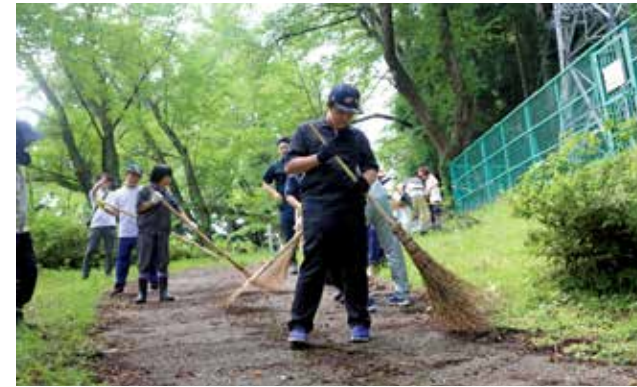
枝や落ち葉でちらかっていた歩道もあつという間にきれいに。

7月21日、角館里山再生プロジェクトの会員と大曲支援学校せんぼく校の小等部、中等部の児童生徒あわせて約40人が天神山、七面山の整備活動をしました。角館神社の境内周辺の歩道に散らばった枝や落ち葉を掃いてきれいにしました。