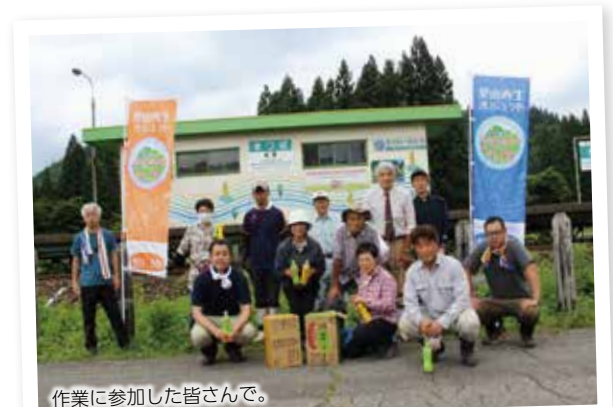
作業に参加した皆さんで。

今後は、赤蕎麦の花の見頃（4月下旬頃から）に合わせた都市交流事業も予定されています。