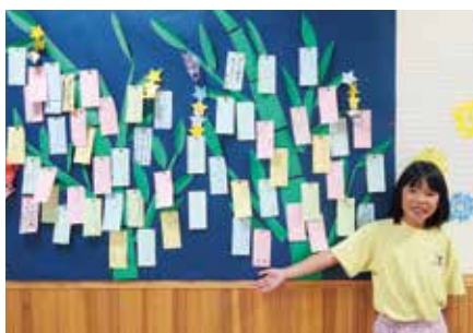
たくさんの願いごとが飾られた七夕コーナー。

おじいちゃんがよくなって早く退院できますように。 マジックがうまくできますように。