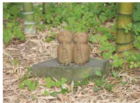
小さなお地蔵さん。