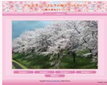
トップ画面イメージ