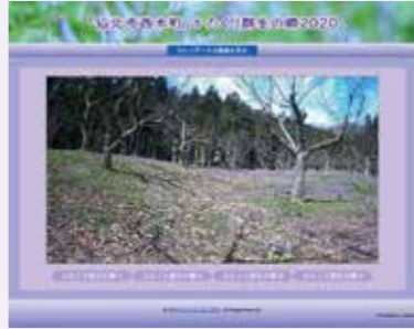
トップ画面イメージ