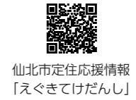
仙北市定住応援情報「えくきてだんし」

仙北市では、若者の市内定着、移住者の定住促進を図るための各種補助事業を行っています。補助金の交付を受けようとする方は申請が必要です。補助要件など詳しくは仙北市ホームページ（ https://www.city-semboku.akita.jp/egukite/index.html ）または地方創生・総合戦略室にお問い合わせください。