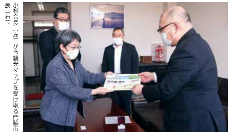
小松会長（左）から観光マップを受け取る門脇市長（右）。