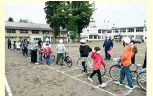
交差点では左右だけでなく、前後も確認しましょう。

4月に入学したばかりの新1年生の児童たちは、横断歩道の渡り方の説明を聞いた後、実際に訓練用に設置された信号機を使って渡り方の練習をしました。また、4年生から6年生は自転車の点検箇所や安全な乗り方について熱心に指導を受けていました。