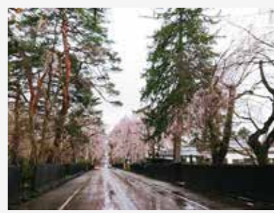
人のいない武家屋敷通りに満開の枝垂れ桜。

しかし、2月下旬には、まずは多くの海外からの撮影隊が撤退していき、3月には国内映画の制作や公開が延期や中止となり、テレビドラマも放送延期を決定する局が増え、そして4月の緊急事態宣言が発令されたからは、ほとんどの作品が中止や延期を余儀なくされています。 そんな中、各地域のFCでも、対応に頭を悩ませているところが多かったです。特に、近年、医療ものや学園ものの作品が多い中、病院や学校での撮影は真先にNGになりましたので、それらの作品が多い連続ドラマでは、放送日も決まっているため、何とか協力してもらえろとケ地を探すのに苦労していました。また、多くのFCが協力しているエキストラ募集に関しても、人を集める行為は規制されているところが多かったため、制作者からの問い合わせにどう対応していくか、JFCにも多くの相談が寄せられました。 JFCでは1月には制作者向けにホームページや公式SNSで、撮影受け入れが難しいロケ地が増えているため、早めにFCに相談をしてほしいと発信しましたが、実際は、地域(担当者)によって対応はまちまちであり、なかなか指針として発信するのは難しいものがありました。ウイルスの感染者が多い地域では、早くから撮影