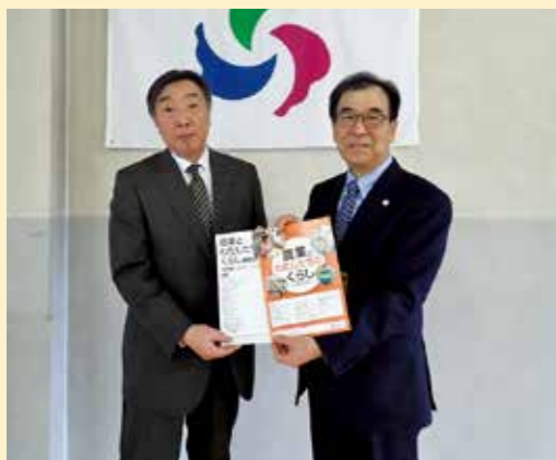
JA秋田おばこの小原組合長(左)から教材を受け取る熊谷教育長(右)。

【問合せ】学校等休業助成金・支援金、雇用調整助成金コールセンター ☎0120-60-3999