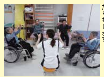
みんなで楽しく体を動かしながらリハビリを行います。

にしき園で行っているリハビリは、起きる・立つ・座るといった基本動作や歩行訓練など、運動器官のリハビリを行う理学療法と、「着替えをする」「入浴をする」などの日常動作や仕事に近い作業動作を通じて心身の機能回復・維持をめざす作業療法の2種類です。 医師の指導のもと、一人ひとりの状態に合ったリハビリを組み合わせて行っています。