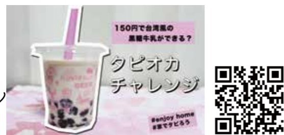
家でタピオカドリンクを作ってみよう!