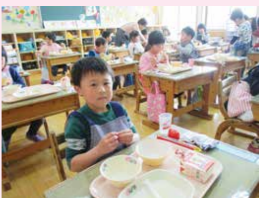
ごちそうさまでした。完食です。

に訪れた1年生にラケットの振り方を教えていました。道場に行ってみると、柔道部がストレッチや筋力トレーニングをがんばっていました。感染症対策のため、組んでの練習ができず、やむを得ないとのことでした。部員は4人です。目標を目標してがんばってほしいです。