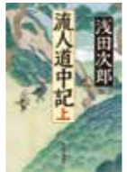
浅田次郎 流人道中記上 《浅田次郎》