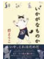
《群衆》 いかなげなもの