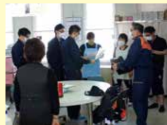
西木消防分署の職員から指導を受けている様子。