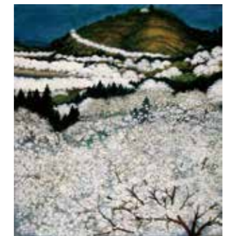
伊藤榮治「古城山に桜」