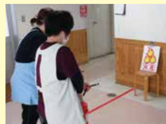
実際に消火器を使って訓練しました。