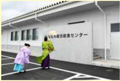
施設の特徴や内部の様子は4月1日号の11～13ページをご覧ください。

同センターは、田沢湖・角館・西木の3給食センターを統合、4月6日から市内の小中学校11校と大曲支援学校せんばく校に約1860食を提供しています。