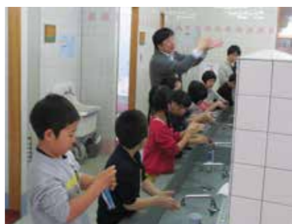
きちんと手洗い、やっています。

春の訪れとともに学校に子どもたちの声が帰ってきました。年度も新たに、ようやく学校の息づかいが感じられるようになりました。