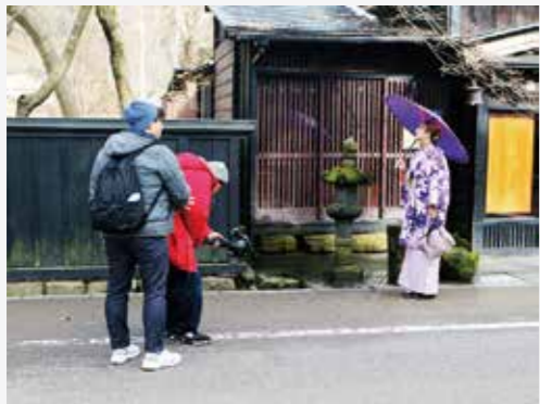
武家屋敷通りでのYouTube 動画撮影風景。