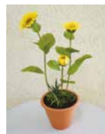
アート盆栽「ひまわり」。