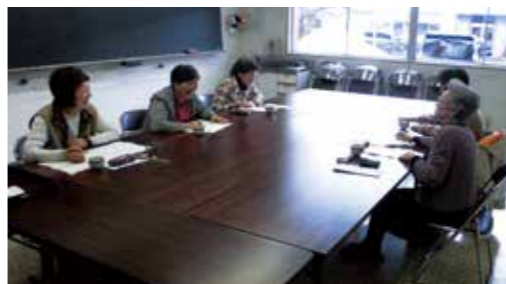
それぞれの思いを短歌にこめて。

皆さんも、自分の思いをのせた短歌を詠んでみませんか。清流の会では一緒に短歌を楽しむ仲間を随時募集しています。参加希望の方は西木公民館へお知らせください。