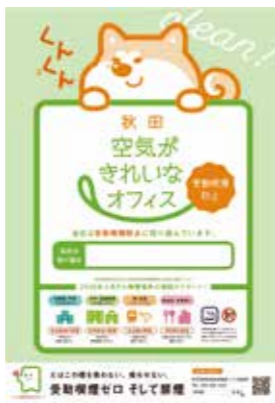
掲示用ポスター (B3サイズ)