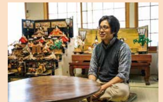
令和元年11月に開業した農家民宿「ホームステイ風雅」の客室で。

こんにちは！時の流れは早いもので、地域おこし協力隊着任から半年が経ちました。今私を取り組んでいるのが「グリーンツーリズム関連宿インタビュー企画」です。今からいきなり私の祖父について書きますが、最後まで読み進めればインタビュー企画の趣旨をご理解いただけると思いますので、しばしおつき合ください。 『私の祖父は沖縄で百姓を生業としており、トマトや島ラッキョウ、ゴーヤーなど、常夏の島の食材を無農薬で栽培している』以上。これだけの情報では秋田において、わざわざ祖父の野菜を食べたいと思わないでしょう。それではこれ