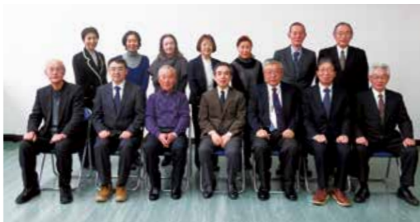
2年間社会教育委員として頑張ります。

社会教育委員は、仙北市の社会教育に関する諸計画の立案や社会教育の推進など、教育委員会の諮問に応じて意見や助言を述べる職務を担っていただいています。この度、新任3人を迎え、15人の委員に委嘱状が交付されました。