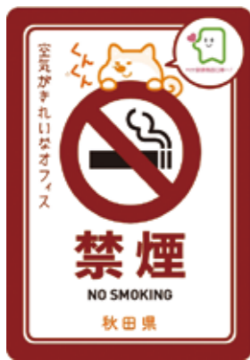
禁煙ステッカー (A5サイズ)

【配布場所】▶秋田県健康づくり推進課 ▶秋田県保健所 【問合せ】秋田県健康づくり推進課 ☎018-860-1429