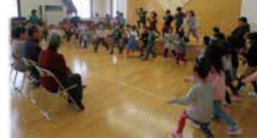
元気いっぱい踊りました。

2月7日、「だしのこ園」を会場に仙北市生涯学習奨励員による「大人と子どもの生涯学習サポートDAY」を開催し、子どもたちと交流を深めました。始めに、絵本の「もたろう」をスクリーンに映し出しなが