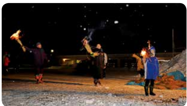
稲わらに火をつけて振り回し、一年の豊作を祈りました。

をつけて振り回し、一年の豊作を願うものです。当日は時折雪が降りましたが、予定どおりお焚き上げやわらたいまつ行進を行いました。その後、生保内神社にお参りをして一年の健康を願う方や揚げパンやそばなどを買求める多くの家族連れなどが会場を訪れました。