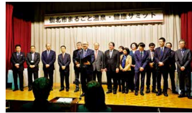
協議会メンバーとゲストによる「ヘルスケア宣言」。

を真心を込めて聞く・友だちなどに嘘をつかない・わかったふりをしない）をしっかりと受け継いでほしい」とあいさつを述べました。 閉校式終了後はグラウンダーガーデンを会場に「中川小学校を語る会」が行われました。参加した方は、閉校記念映像を鑑賞し、当時の思い出話に花を咲かせていました。