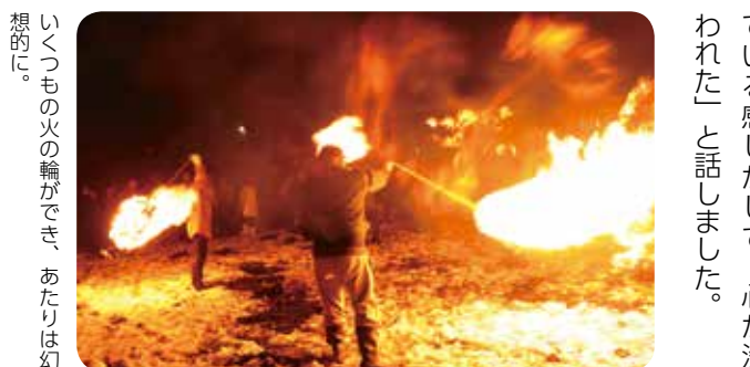
いくつもの火の輪ができ、あたりは幻想的。