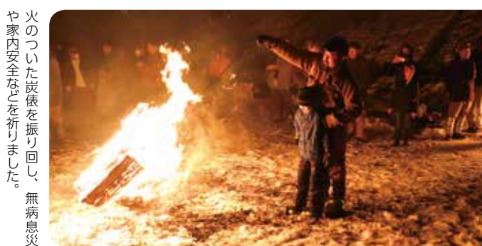
火のついた炭俵を振り回し、無病息災や家内安全などを祈りました。