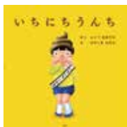
いちにもうんち 《いづちかつらつち》