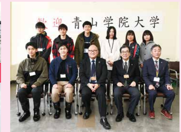
学生の中には初めて雪を見る人も。雪国ならではの暮らしを体験しました。