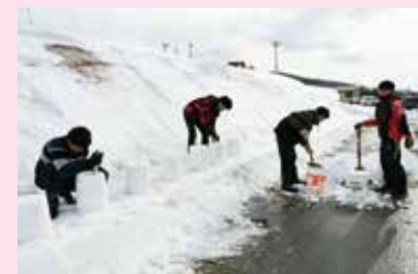
なれない雪に苦戦しながらも田沢湖高原雪まつりの会場づくりを体験！