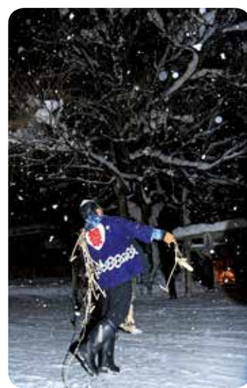
枝にかかるまで何度も投げかけていました。

2月8日、中里寒之神堂前（桧木内字中里）で「中里のカンデッコあげ」が行われました。当日は雪が舞う中、中里地区の住民や観光客が朴の木で作った小型の鍬（カンデッコ）と男根をかたどったク