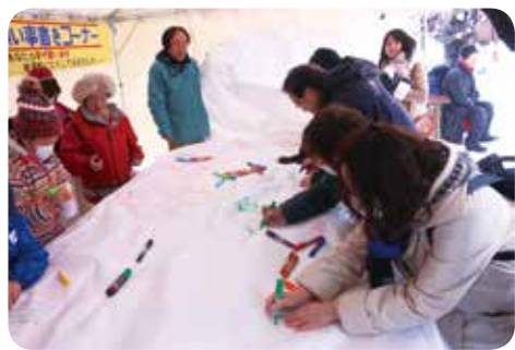
紙風船に願いごとを書くことができるコーナーは、早めですべて埋まってしまうほどの人気ぶり。

そして、一斉打ち上げの18時。会場内にカウントダウンが響き渡り、上桧木内地区8集落から五穀豊穡や家内安全などの願いを込めて紙風船を打ち上げると来場者から歓声が起こりました。紙風船は、ここにこども園の園児が作ったものをはじめ、形や大きさが違う様々なイラストが描かれた約100基が夜空