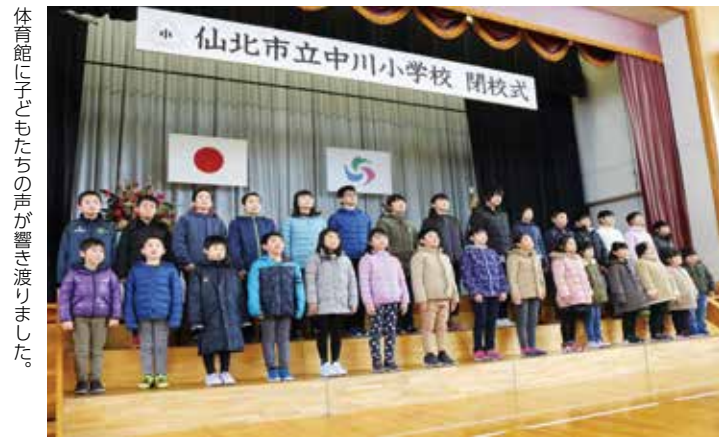
体育館に子どもたちの声が響き渡りました。