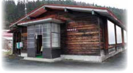
現在の田沢診療所。