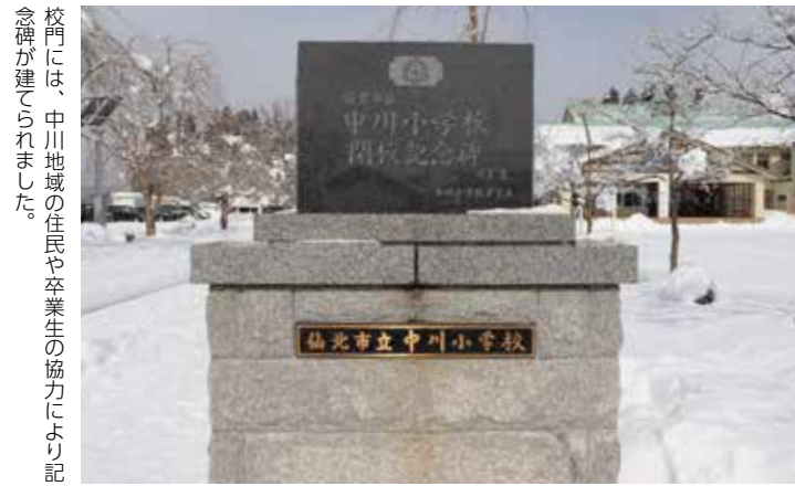
校門には、中川地域の住民や卒業生の協力により記念碑が建てられました。