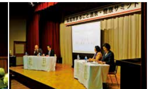
パネルディスカッションの様子。