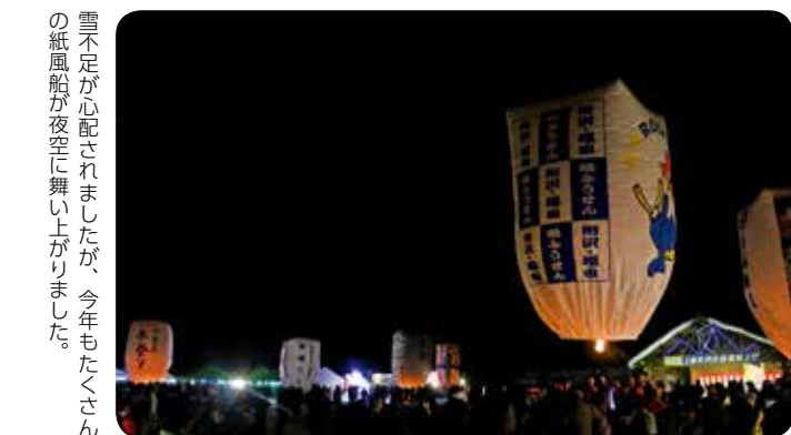
雪不足が心配されましたが、今年もたくさん紙風船が夜空に舞い上がりました。

上げ日和になりました。昼風船上げでは、ひのきないこども園の園児や桧木内小・中学校などの児童が自分たちで作った紙風船を打ち上げようと周りには大きな輪ができました。