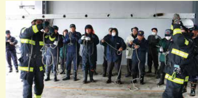
綱の結び方を習得しようと熱心に説明を聞く参加者。

1月20日、屋根の雪下ろし作業時の転倒防止をしようと雪下ろし講習会が開催され、市民や事業所などから約80人が参加しました。 講習会の前半は、神代就業改善センターで大曲労働基準監督署から除排雪の事故防止対策、仙北警察署から雪害事故の発生状況、秋田県仙北地域振興局から雪下ろし安全対策用具の貸し出しについてそれぞれ説明がありました。