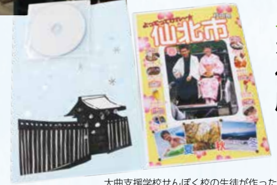
大曲支援学校せんぼく校の生徒が作った観光ガイドブックと封筒。仙北市の魅力が詰まっています。

皆さんの授業の集大成！ 仙北市の魅力がたっぷり詰まった観光ガイドブックは仙北市ホームページから！！