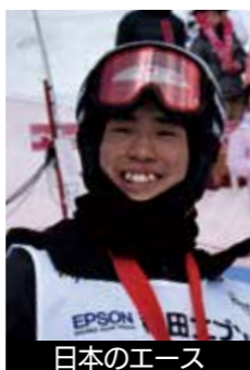
堀島 行真 HORISHIMA Ikuma

ー昨年のワールドカップ秋田たざわ湖大会ではモーグル、デュアルモーグルの2冠を制し、昨年はワールドカップ総合2位。今季も開幕戦モーグル2位、第2戦モーグル優勝と好調を維持し、総合2位と王者キングズベリーを猛追している。今大会最も注目される日本のエースに期待したい。