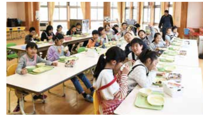
美味しいですか？の問いに、4年生のみんなは「美味しい〜!!」と答えてくれました。

1月24日、市内の小中学校の給食で、佐竹北家ゆかりの料理「御狩場焼」が提供され、子どもたちは地元の名物料理を美味しくいただきました。 これは、1月24日から30日までの「全国学校給食週間」にあわせて提供されたもので、今年で4年目になります。 御狩場焼は、鶏肉に山椒みそをつけて焼いた料理で、江戸時代に佐竹北家の殿様が狩猟の際に食べたといわれています。 取材に訪れた西明寺小学校では、御狩場焼を食べた児童たちが満面の笑みを浮かべながら美味しそうに味わっていました。