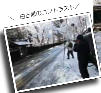
白と黒のコントラスト！