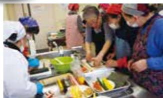
本場の味を食卓に。