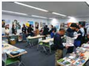
来場者で賑わうロケ地フェア。