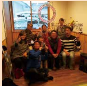
みんなで記念撮影。

きました。当日は10人程のお客さまが、県外含め市内外からドローンカフェにお越しいただき、操縦体験や、ドローンQ&A、マイクロドローンレースなどをを行い、皆さんと楽しく交流させていただきました。 ドローンは飛ばすためだけに利用するのではなく、Science（科学）、Technology（技術）、Engineering（工学）、Mathematics（数学）などの学習要素を備えていると考えています。ドローンのみならず、多くの産業はテクノロジが大きくけん引しています。今後定期的に開催し、この地域の将来を担う子どもたちや、多くの皆さんにドローンやプログラミングなど、最新のテクノロジに興味を持つきっかけを提供する場所になれば嬉しいなと思います。