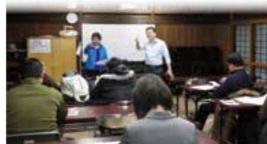
真剣に講座を聞く様子。

角館公民館では、1月16日から全5回（毎週木曜日）の日程で「たのしく学ぶ中国語講座」を開講しました。