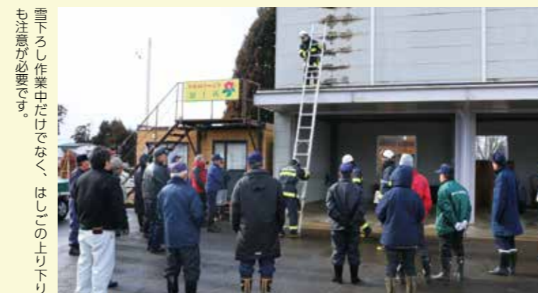
雪下ろし作業中だけでなく、はしこの上り下りも注意が必要です。

1月20日、屋根の雪下ろし作業時の転倒防止をしようと雪下ろし講習会が開催され、市民や事業所などから約80人が参加しました。 講習会の前半は、神代就業改善センターで大曲労働基準監督署から除排雪の事故防止対策、仙北警察署から雪害事故の発生状況、秋田県仙北地域振興局から雪下ろし安全対策用具の貸し出しについてそれぞれ説明がありました。