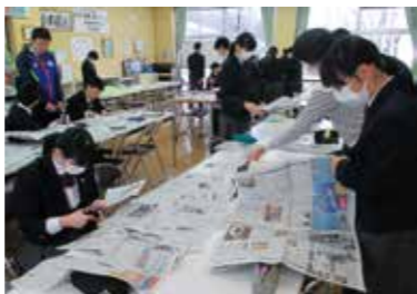
気になる記事がどんどん見つかる！

普段から朝や帰りの会の中で、気になった新聞記事を学級で紹介し合い、感想や考えを交流しています。また、他学年へ出向き、記事を紹介する活動も行っています。