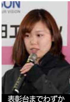
表彰台までわずか

今シーズン第3戦中国 Thaiwoo 大会デュアルモーグルでは、自己最高4位に入るなど今季上々の滑り出しといえるだろう。ワールドカップ参戦4年目となり、表彰台もあと一步のところまできた。秋田たざわ湖大会では表彰台に上がる姿を日本のファンに見せてほしい。