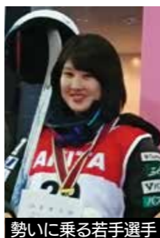
勢いに乗る若手選手

可能性が期待されていた若手がついに台頭。今季開幕戦フィンランドRuka大会で、デビュー戦にもかかわらずモーグル2位、第2戦モーグル5位と破竹の勢を見せている。秋田たざわ湖大会でも彼女と世界の強豪選手との対決から目が離せない。飛躍の年となりそうだ。