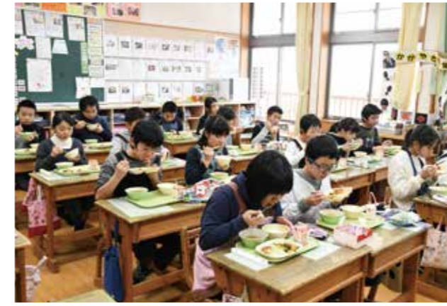
6年生は味わって食べていました。