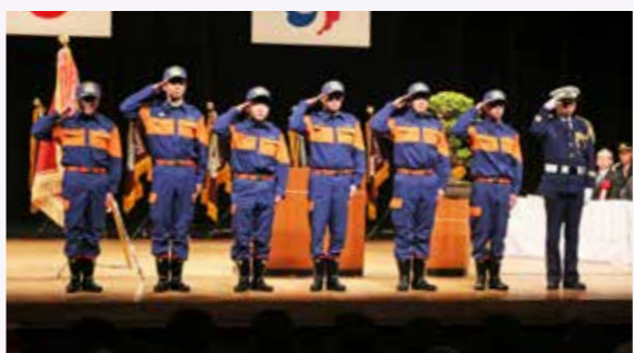
新入団員の紹介も行われました。