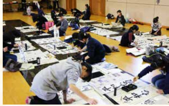
真剣に筆を運ぶ参加者。

お正月恒例の「第15回仙北市新春書初め大会」が1月7日、角館交流センターで開催されました。 今年小学生・中学生・高校生あわせて37人が参加、「ともだち」「正しい心」など学年ごとに決められた課題に取り組みました。 参加者は納得のいく1枚が完成