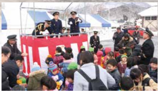
分列行進後に行われた餅まき。子どもたちは大喜びでした。