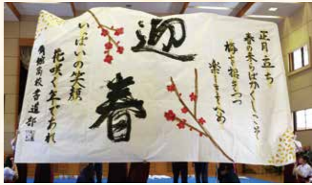
角館高校書道部による書道パフォーマンス。力強い見事な作品ができて上がりました。

するまで、時間いっぱい熱心に筆を走らせていました。 書初めの後には角館高校書道部による書道パフォーマンスが披露され、音楽に合わせて力強く流れるような筆さばきで作品を作り上げていました。完成した作品を見た観客からは、大きな拍手が送られました。