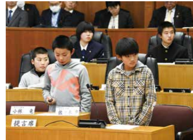
これからの仙北市を考え、様々な提案を行った子どもたち。自分のふるさとを考えるよい機会になったようです。