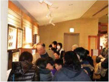
昆虫の標本に興味津々。