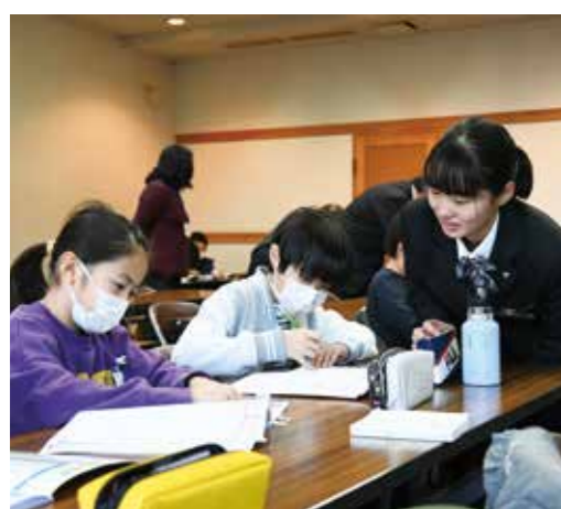
分かりやすい説明に子どもたちも納得です。

12月27日と28日、19年目を迎えた第36回の「角館キッズ学び教室」が角館交流センターで行われ、市内外の小学生91人が参加しました。この教室は「楽しい学習オタスケマンの会(草薨稔会長)」が子どもたちの自学自習を支援しようと、毎年、夏・冬の長期休みに開催しています。今回も、現職や退職した先生、市民などの「オタスケマン」と角館高校生2人による「フレッシュオタスケマン」の総勢32人の皆さんが、子どもたちの勉強の手助けをしました。オタスケマンの丁寧な指導に子どもたちも真剣に取り組んでいました。