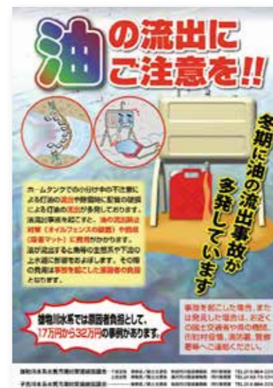
雄物川水系水質汚濁対策連絡協議会より