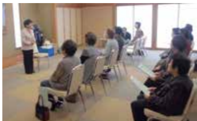
昔話を聞く参加者の皆さん。

参加した皆さんは、「普段外出する機会がないので、楽しみにしている」、「来年もぜひ参加したい」などと話していました。