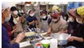
講師のお手本を真剣に見る受講者。