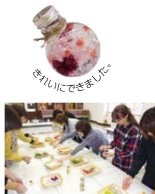
イメージしながら選びました。

田沢湖公民館では、10月2日、11月6日に「ハーバリウム体験教室」を開催しました。講師の指導を受けながら受講者それぞれが多様なドライフラワーを選び、小瓶の中に飾りつけ、個性豊かな作品を完成させていました。 受講者からは、「作り始めのイメージよりよかったです!」「次回はもっと綺麗に作りたい!」「来年も開催してほしい!」などと声が上がりました。好評の教室となりました。