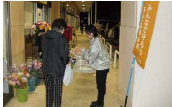
店頭で子どもへの虐待防止を呼びかけました。

今年の標語は「189(いちはやく)ちいさな命に待ったなし」です。児童虐待は社会全体で解決すべき問題です。虐待かもと思ったらすぐにお電話ください。