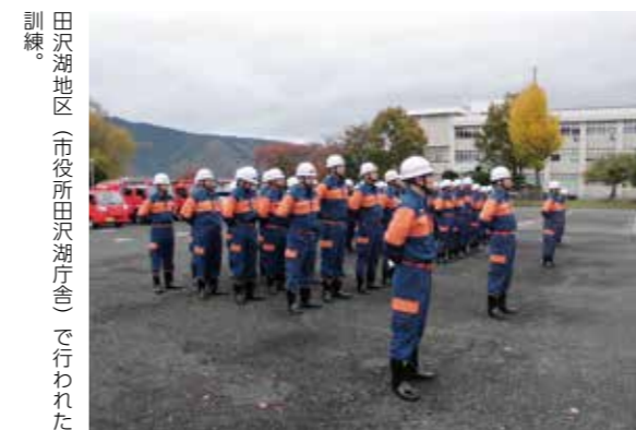
田沢湖地区(市役所田沢湖庁舎)で行われた訓練。

11月3日から9日まで「秋の火災予防運動」が実施されました。 初日には、仙北市管内3か所で行った訓練が行われました。 この訓練は、火災発生時に消防団員が迅速に災害現場へ駆けつけることができるよう、春と秋に行っているものです。 これから気温が低くなる時期は、空気の乾燥により火災が発生しやすい気象状況となります。火気の取り扱いには十分に注意しましょう。