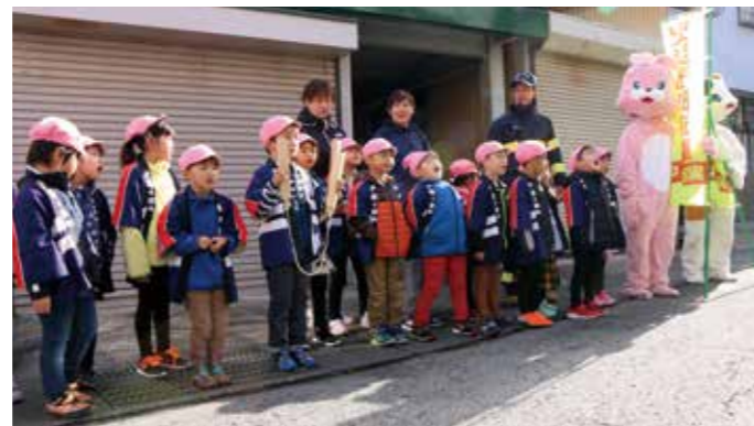
火災予防を呼びかける園児たちの元気な声が響きわたりました。

秋の火災予防運動 園児たちが 防火パレード 11月6日、秋の火災予防運動の一環で、だしのこ園の園児たちが防火パレードを行いました。これは大曲仙北広域市町村圏組合角館消防署田沢湖分署が防火意識を高めることを目的に行っています。 この日出動したら歳児22人の「だしのこ消防隊」。だしのこ園から男坂通りを通過してピフレ田沢湖店までを拍子木を鳴らしながら「火の用心！マッチ一本火事のもと！」と元気な声で呼びかけながら行進しました。 ピフレ田沢湖店では、買い物にきたお客さんに「気をつけてください」と声をかけながらパンフレットを手渡しました。