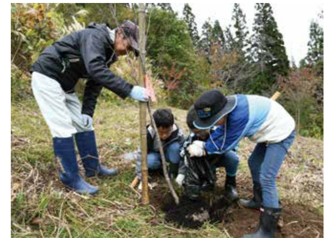
参加者は協力して穴を掘り、サクラの苗木を丁寧に植えていました。

当日は、地元住民や花葉館の従業員など約40人が参加、用意されたオオヤマザクラ20本の苗木をきれいな花が咲くように心を込めて植樹しました。