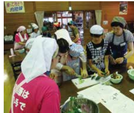
真剣に調理する子どもたち。家でも作ってみたいとの声が聞かれました。

親子で簡単にできる栄養バランスのとれたメニューと一緒に調理・試食したほか、食べ物についてのお話や食育ゲームを通して、元気な体を作るために、バランスよく食べる方法と朝食の大切さについて楽しみながら学びました。食生活改善推進協議会では、このほかにも様々な食育活動や研修会を開催しています。興味のある方は仙北市保健課（☎55・1112）までお問い合わせください。