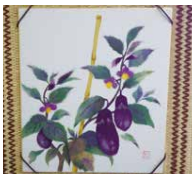
ずっと見ても飽きません。