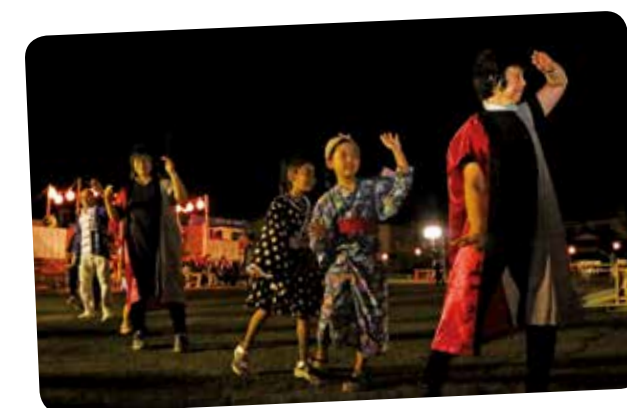
子どもからお年寄りまで参加し、大きな輪が広がりました。

8月21日、市役所田沢湖庁舎駐車場を会場に「第49回生保内節盆踊り大会」が開催されました。当初は20日に開催予定でしたが悪天候が予想されたため順延しての開催となりました。