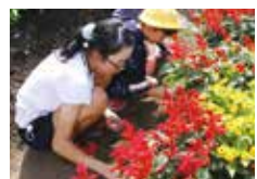
自分もかがやくために一生懸命がんばっています。

花壇のほかにも、学校の裏手には、ブルーベリーの樹木が茂り、7月には実ったブルーベリーを全校でおいしくいただきました。さらに裏手のフェンス沿いには、約30以上に渡ってひまわりが一列に並び、きれいな花を咲かせています。