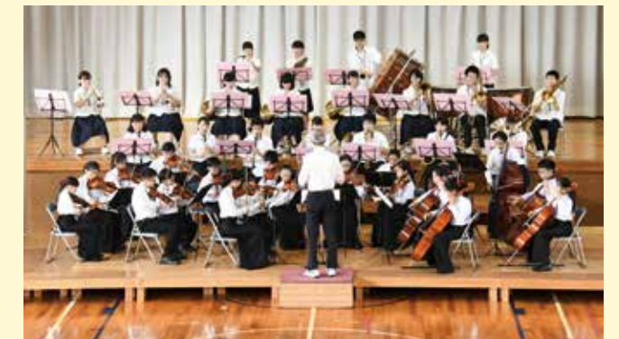
合同による「ウィリアムテル序曲」演奏の様子。数時間前に会ったばかりとは思えないほど素晴らしい演奏でした。