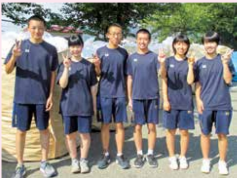
回収したアルミ缶の山を背に。

新田目生徒会長は「これまでの大きな活動としては、台湾の北投中学校との交流や日常でのあいさつ運動があります。北投中学校とは手紙で