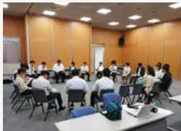
車座になったFC研修会。