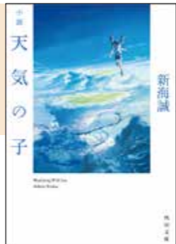
小説 天気の子 (角川文庫) 《新海誠》