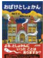
おぼけとしょかん (斎藤洋、森田みちよ)