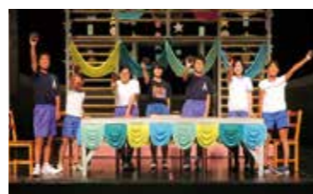
大きな声で夢を叫ぶシーン。

子どもたちからは、「学校も違うし、学年も幅広いのに、こんなに楽しいと思わなかった」「来年もまた参加したい」という声が上がりました。