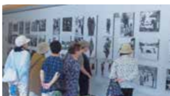
農業の歴史を感じています。

7月26日、1回目の講座として、大仙市にある秋田県立農業科学館を見学しました。江戸時代から昭和30年代までの農業の進化や県内農業の新しい情報などを学びました。参加者の皆さんは、昔の農村風景の写真を見ながら、思い出を語り合っていました。