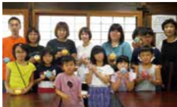
みんな上手にできました。

教室には6組13人の親子が参加し、子どもたちは、お父さんお母さんと一緒にソーブカービング用の石けんをカッターや彫刻刀で上手に削り、デコレーションなどを施しながら完成させました。参加者からは、「思っていたよりも簡単に作ることができて、子どもよりも楽しんでしまった」と好評でした。12月21日(土)にも開催する予定ですので、興味のある方は、ぜひお申し込みください。みんな上手にできました。