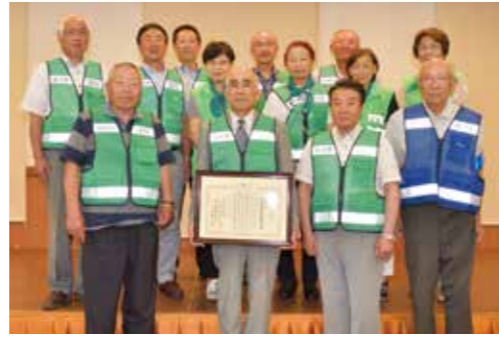
東北管区優良防犯団体表彰を受賞された角館支部の皆さん。