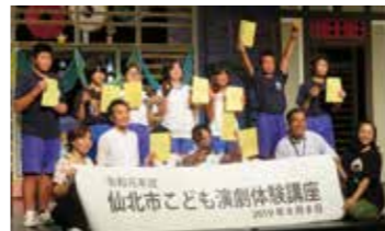
大成功に終わりました。