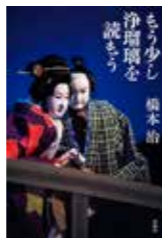
夏の騎士 《百田尚樹》 もう少し浄瑠璃を読もう 《橋本治》

新潮社記念文学館「巡回展 矢来町のたからもの」の関連展示です。世に名を知られる「文豪」と呼ばれる作家たち、夏目漱石・太宰治・島崎藤村など、たくさんの名作を読みやすい新装版や大活字本でお楽しみください。