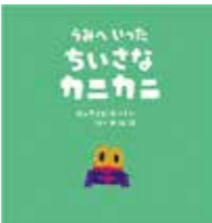
うみへいったちいさなカニカニ (クリス・ホートン)