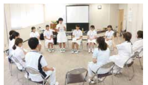
実際に体験して感想を発表する参加した高校生。

8月1日、市立角館総合病院で「一日看護学生」が開催されました。これは公益社団法人秋田県看護協会の事業の一環で、夏休み期間中の高校生を対象に、施設見学や看護体験を通して看護職に関心を持ってもらおうと実施されているものです。