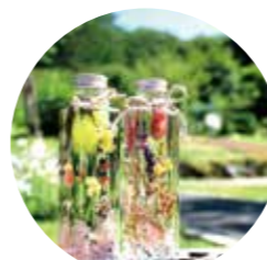
透明感が素敵です。