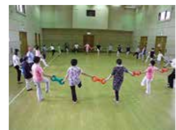
研修会の様子。「3B体た。操」では音楽に合わせて楽しく体を動かしました。