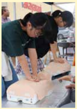
実際に心肺蘇生を体験する参加者。

参加者は「子どもが楽しもうでよかった。大人の自分も知らないことを知ることができた。」