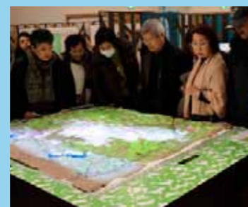
プロジェクションマッピングジオラマ