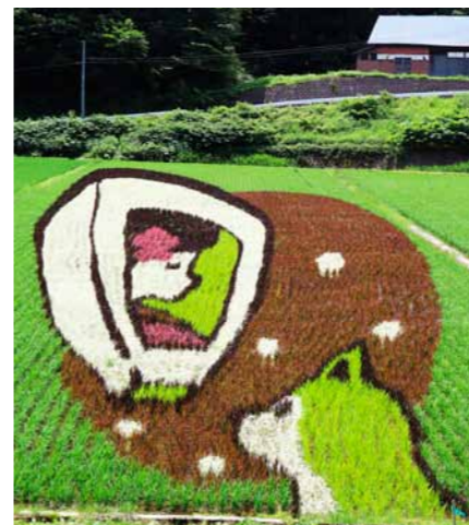
上桧木内の紙風船