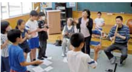
手拍子にあわせて、調子を整えて唄おう。

ボランティアの先生方は子どもたちの上達ぶりを喜んでいて、「ステージに上がると子どもたちの姿が映える。今年も見るのが楽しみ」と話してくれました。9月22日の三省祭が待ち遠しいですね。