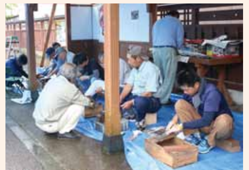
立町ポケットパークで行われた無料の包丁研ぎの様子。