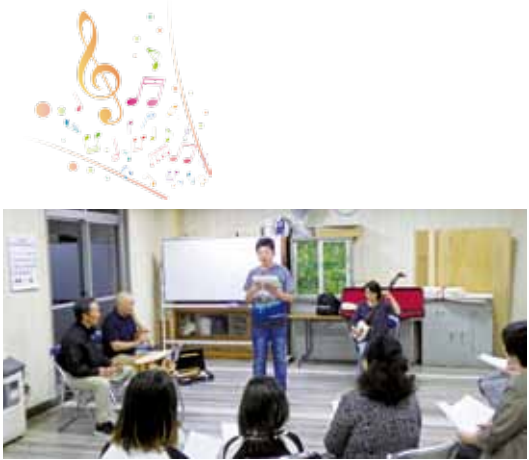
生演奏で唄っています。