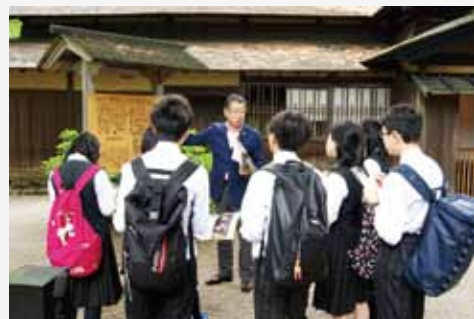
中学生は岩橋家の案内を興味深く聞いていました。

仙北市では毎年、修学旅行で訪れた中学生の職場体験を受け入れています。かくのだてフィルムコミッションも数校を担当します。6月11日には、札幌市立伏見中学校の6人の生徒を武家屋敷通りに案内しました。武家屋敷の岩橋家では、映画「たそがれ清兵衛」の撮影で下級武士の住まいとして使われたことや武家屋敷の特徴ある造りについて、松本家では、ロケセットでは表現できない屋根のクケなどの自然を活かしたところが好まれていたりすることなどお話ししました。それから、武家屋敷通りは景観に配慮して電線が見えないので、撮影を行う側からも喜ばれることを説明しました。関心を持った生徒から、電線はどこにあるのかという質問もありました。武家屋敷通りとは別の道路沿いにあると話し、実際にその場所を確認すると納得した様子