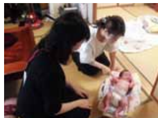
体重測定をします