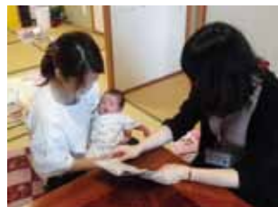
母子手帳を見ながらお話