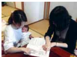
予防接種についてのお話