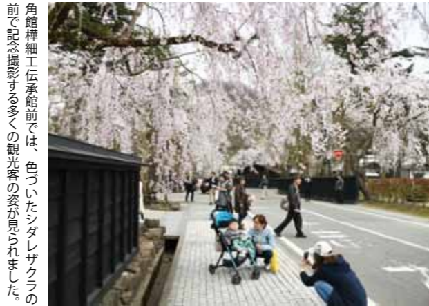
角館榊細工伝承館前では、色づいたシダレザクラの前で記念撮影する多くの観光客の姿が見られました。

開幕当初はつぼみだった武家屋敷通りのシダレザクラは25日、松木内川堤のソメイヨシノは26日に満開を迎え、全国から綺麗に咲き誇った桜を一目見ようと多くの観光客が訪れ、色づいた桜を堪能していました。