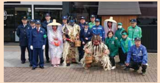
活動を行った皆さんで。

皆さん、こんにちは。 新緑も深まり目にも心にもよい季節になってきましたね。内陸線活性化担当の協力隊として着任して1年10か月、まだまだこの雄大な自然に感動の毎日を送っています。 桜まつり初日の4月20日、角館駅前「落とし物、忘れ物の注意喚起、盗難被害防止、何かあったら110番に連絡して」と4か国語で 書かれたティッシュやチラシを観光客の方へ配りました。 この活動は角館駅前交番、他近隣駐在所、仙北市防犯指導隊、仙北市防犯協会角館支部、仙北市角館防犯巡回隊の方々と行ったのですが、ただ配るだけではつまらないということで、地域おこし協力隊は秋田名物のなまはげとこまち娘に変身しました。なまはげは地域おこし協力隊の