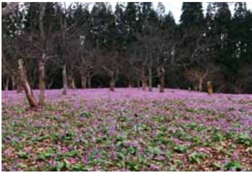
規模・密度ともに日本最大級といわれるかたくり群生の郷。20ヘクタールの広大な敷地に可憐な花が広がりました。