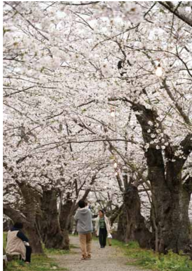
松木内川堤のソメイヨシノ。咲き誇った桜のトンネルを歩いていると時間を忘れず。