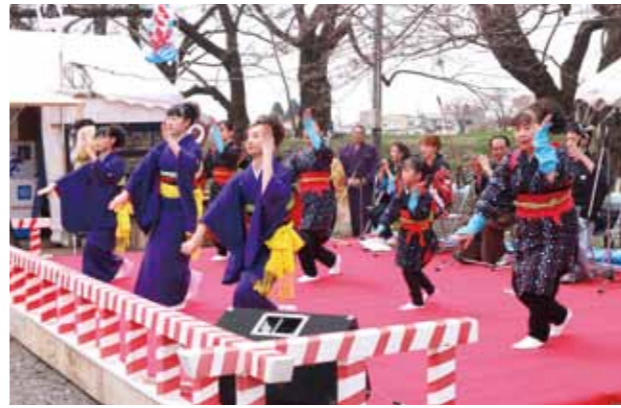
オープニングセレモニーでは、おやま囃子が披露され、桜まつりの開幕をお祝いました。

4月20日から5月5日まで、角館の桜まつりが開催されました。初日には、開幕に先立ち松木内川堤前の特設会場でオープニングセレモニーが行われ、関係者による鏡開きやおやま囃子が盛大に披露されました。