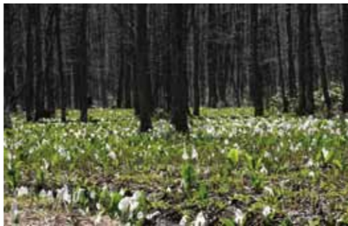
ハンノキ林に囲まれた約3ヘクタールの湿原に、水ばししょうが一面に咲き誇りました。