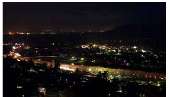
古城山からの眺望。ライトアップされた松木内川堤の桜のトンネルが浮かびあがります。