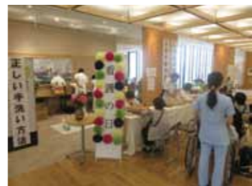
問合せ/市立角館総合病院 ☎54-2111