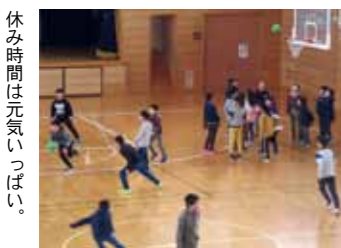
休み時間は元気いっぱい。

何を食べても食べても、何でも楽しみなんでしょう。何ととっても仲間たちと一緒に旅行だからこそ、の楽しみがありますね。