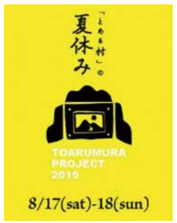
イベントは、8月17日(土)と18日(日)に開催予定です。当日は、ぜひお越しください。

皆さんへメッセージ 今年の取組の中でも特に力を入れているのは、「とある村の夏休み」という刺巻を舞台とした音楽フェス、トークセッション、青空ヨガと盛りだくさんなイベントです。農業、音楽、アクティビティ、暮らしを考えるイベントになるよう仙北市の若手グループで準備を進めています。皆さんに楽しんでもらえるよう頑張ります!