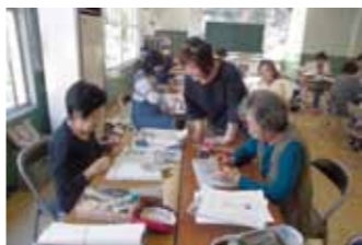
昨年の教室の様子です。