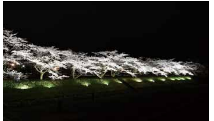
暗闇に浮かぶライトアップされた桜は、幻想的でその美しさに息をのみます。