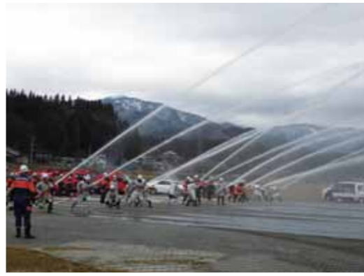
西木地区（松木内河川公園）で行われた駆け付け訓練。

4月7日から13日まで「春の火災予防運動」が実施され、最終日には、仙北市管内3か所で開催された訓練が行われました。 この訓練は、火災発生時に消防団員が迅速に災害現場へ駆け付けられることができるよう、毎年行っているものです。 これから気温が高くなる時期は、空気の乾燥により火災が発生しやすい気象状況となります。安全第一を心がけ、火気の取り扱いには十分に注意しましょう。