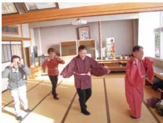
心も体も若くなりますよ。

今回、久しぶりに参加された方もいて「やっぱり踊りは楽しい」「体が生き生きする」「足腰にいいな」などと話していました。健康で、楽しく「一石二鳥」です!