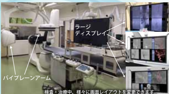
GEヘルスケア・ジャパン社のIGS630。

平成29年4月1日に新病院へ移転し、我々にとって手足ともいえる脳血管撮影装置も新規機器が導入されました。新たな装置はGEヘルスケア・ジャパン社のIGS630で、バイプレーンアームにフラットパネルディテクター(平面検出器)が装備された最新機器です。