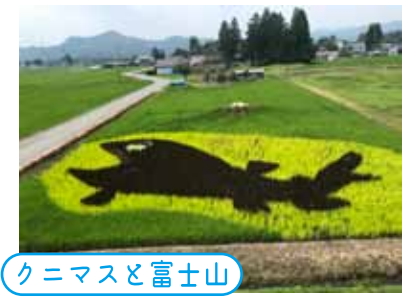
クニマスと富士山