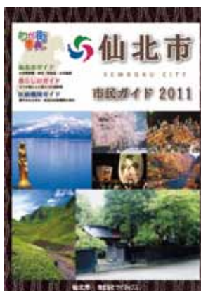
平成23年7月に発行された『仙北市市民ガイド2011』

広告の詳細については、㈱サイネックス秋田営業所 ☎ 018-8333-6700 までお問い合わせください。