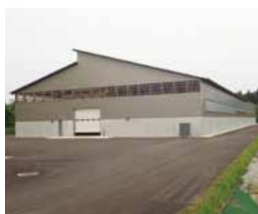
4月1日から稼働している仙北市堆肥センター。