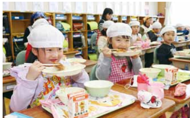
御狩場焼の美味しさは児童たちに好評でした。

1月24日から30日までは、学校給食の意義や役割につ いて理解を深める『全国学校給食週間』となっています。