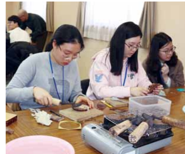
榊細工体験でコースターづくりに励む韓国の高校生。

1月19日から23日にかけて、韓国青年研修団(大学生34人、高校生34人)が仙北市を訪れました。一行は、市内の農家民宿に宿泊し、雪遊びや上桧木内の小正月行事で使用される紙風船の絵付けをしたり、榊細工体験やあきた芸術村で踊り体験を楽しんだりしました。また、仙北市と大曲農業高校が連携協定を締結している縁で、高校生同士による学校交流が行われ、生徒たちは、調理実習を通じてコミュニケーションを図りながら、ロールケーキや豆腐作りに挑戦しました。