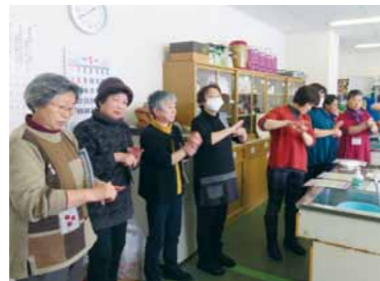
正しい手洗いの方法を学ぶ参加者。

第2部では県庁の出前講座を利用した「食品 の表示」についての講義があり、法改正による 変更点やさまざまな食品の表示手順の知識を得 るよい機会となりました。