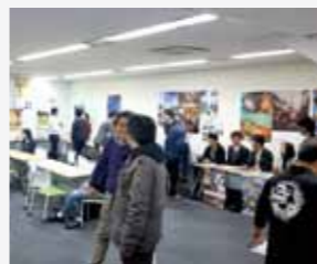
来場者で賑わうロケ地フェア