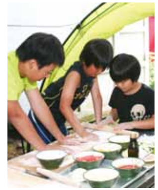
みんなでピザ作りづくりに挑戦。

8月7日から9日までの3日間、宮城県の女川町や石巻市などの小学生21人が仙北市を訪れ市内農家民宿に滞在し、農山村体験、自然体験を通じて交流を深めました。