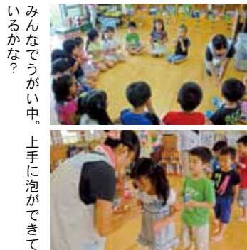
みんなでうがい中。上手に泡ができているかな？

むし歯予防は継続することが大切ですので、フツ化物のうがいを集団で行うことは、定期的に確実に実施することができるため、むし歯予防には有効とされています。