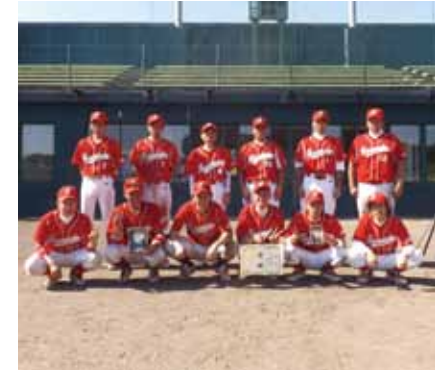
白熱の決勝戦を制し優勝の田沢湖BCチーム。

開会式では市長が「角館高校の甲子園初出場のお祝いと来年は市長杯が10年の節目の大会に当たり、みんなで盛り上げたい」とあいさつしました。大会は一回戦から好試合が展開され、決勝戦は、前年度優勝の今光学チームと前々年度に優勝をしている田沢湖BCチームとの対決となり、両者譲らぬ投手戦の末、ワンチャンスをものにした田沢湖BCチームが1対0で、2年ぶり3回目の優勝を遂げました。