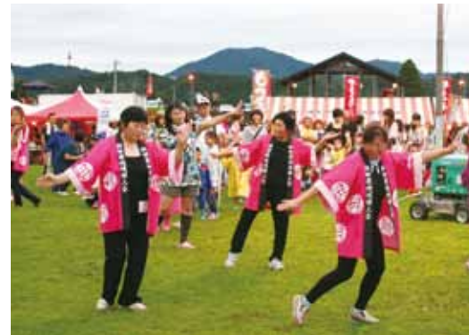
皆さんが輪になり盆踊りを楽しみました。