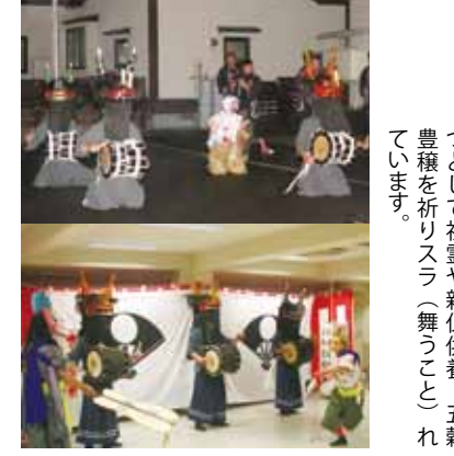
ささらは、佐竹家が常陸から秋田に国替えになった際に伝わり、400年以上の歴史を持つといわれています。現在は盆行事の一つとして祖霊や新仏供養、五穀豊穡を祈りスラ(舞うこと)をいいます。

8月15日、ささら舞が昼の部、夜の部の2回にわたり、角館地区で行われました。角館の観光行事実行委員会の主催。昼の部は角館榊細工伝承館で広久内ささら、白岩雲巖寺で白若ささらと室野口ささらが、夜の部では角館中心市街地活性化支援センター(かつらぎ)で広久内ささらと白若ささらがそれぞれ勇壮な舞を披露しました。