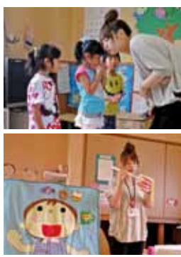
大きなうがいの音は聞こえるかな？歯の磨き方は2本ずつ、1か所10回磨きます。

歯科巡回指導 大仙保健所の歯科衛生士さんが、市内の園を巡回してうがいの仕方や歯の健康教育を実施しました。（7月～8月まで各園を巡回）