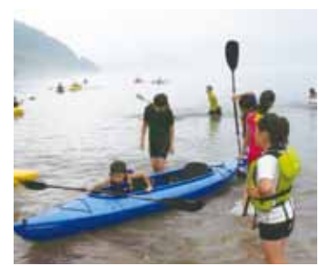
カヌー体験を楽しむ子どもたち。県事業「秋田発・子どもふるさと交流推進事業」を活用し、仙北市農山村体験推進協議会が実施しています。