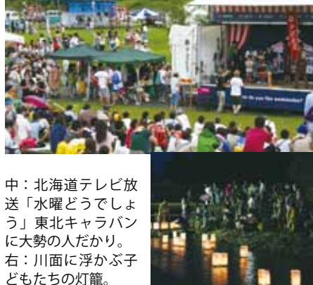
中：北海道テレビ放送「水曜どうでしょう」東北キャラバンに大勢の人だかり。 右：川面に浮かぶ子どもたちの灯籠。

8月17日、1年ぶりに開催された戸沢氏祭。新成人の殿様一行と地元小学生、婦人会等が領民に扮し、総勢200人余りのお家行列が、真山寺を出発後、門屋城址を経由し、主会場の河川公園まで練り歩き、沿道や公園で待つ大勢の観客を魅了しました。 会場では伝統芸能の発表やステージショー、魚のつかみ捕りや盆踊りなど、楽しめる催し物が行われ、最後の花火大会では、夜空を飾る綺麗な花火に歓声が上がりました。大人から子どもまで祭りを満喫しました。