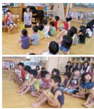
あわわわチャンピオンに向かって2列でぶくぶくうがい中。

対象 年長児（5～6歳児）（開始前に保護者から希望を伺っています） 実施率 98・5％ うがいの時間 給食のあと歯磨きをしてから行っています。約1分間。