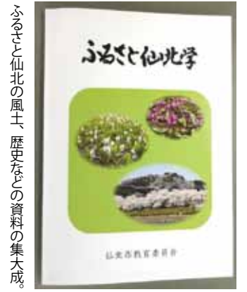
ふるさと仙北の風土、歴史などの資料の集大成。

仙北市教育委員会の北浦教育文化研究所が中心となって、ふるさとの豊かな自然や文化、歴史、偉人、伝統工芸などの資料を集大成した冊子「ふるさと仙北学」が完成しました。