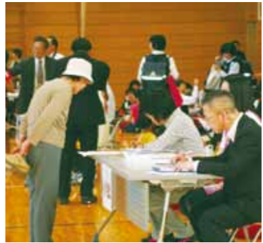
神代小学校体育館に訪れた保護者への児童、生徒の引き渡し確認作業

5月27日に、神代中学校、神代小学校、神代こども園が合同防災訓練を行い、災害後に児童、生徒を保護者へ引き渡すまでを確認しました。