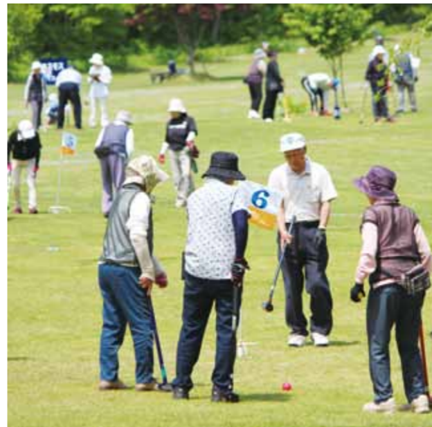
好天の下、主会場の花葉館グラウンドゴルフ場では、参加者が楽しみながらプレーを続けました