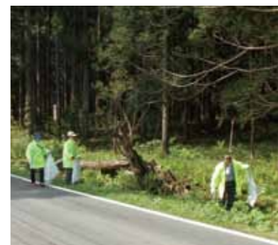
国道105号沿い作業風景 道路沿いのゴミがきれいに片付けました