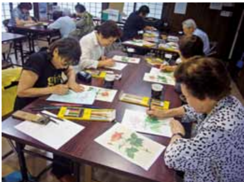
昨年開催された「大人のぬり絵サロン」の様子。見本を見ながらぬり絵を楽しみます。