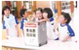
参加票を提出 (西明寺小)