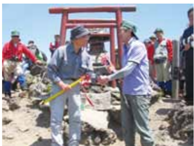
頂上での鞆石町からの一行との交歓会。ピッケルを交換し山開きを祝いました