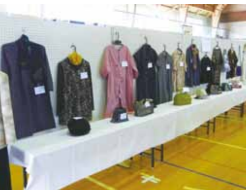
教室で作った作品は、秋に開催される文化祭などにも出展しています。