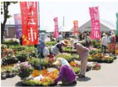
今回開催された「花の市」。大勢の皆さんが花の苗を買い求めました