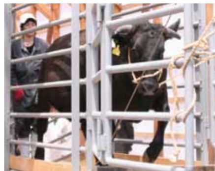
大きく育った牛は1頭づつ体重を計量の後、運搬用トラックへと運び込まれました

平成25年に秋田県と仙北市が誘致した秋田仙北夢牧場(株)で、6月3日、F1と呼ばれる交雑種(25～26か月齢)28頭が、秋田市、横浜市の食肉市場に向けて初出荷されました。 県産肥育牛の生産拡大と大規模経営のモデルとなる本牧場は、現在3棟の牛舎が完成し、黒毛和牛や交雑種が約500頭が肥育されています。交雑種の出荷と共に、今後は全て黒毛和牛を肥育していく予定です。