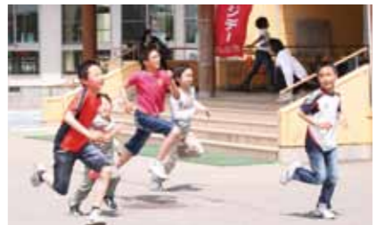
体力作りの時間「パワーアップタイム」で校内周回コースを走る児童たち (西明寺小)

5月28日、継続して15分以上の運動やスポーツ等を行った住民の参加率(%)を人口規模が同程度の自治体と競う住民総参加型スポーツイベント「チャレンジデー」が行われました。 主会場となった花葉館グラウンドゴルフ場では、開会セレモニーが行われた後、約200人の参加者がグラウンドゴルフを楽しみました。 その他、武家屋敷通りでのウォーキングやラジオ体操など気軽に参加できるイベントが市内各地で催されました。 今回で4回目となる仙北市の参加率は48・1%、対戦自治体の広島県北広島町の参加率47・5%を上回り、今回の対戦に勝利しました。 市民の皆様には、たくさんのご参加をいただきありがとうございます。