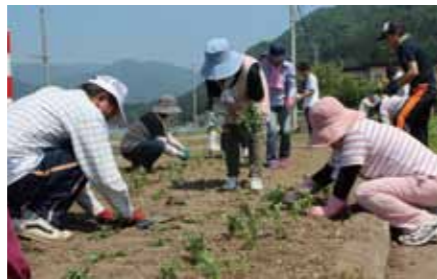
地域の皆さんにより、用意した5万6千本の苗が国道脇に植えられました