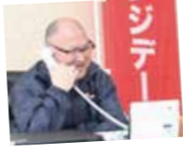
前日、門脇市長が北 島町の眞野博司 町長とエール交換

5月28日、継続して15分以上の運動やスポーツ等を行った住民の参加率(%)を人口規模が同程度の自治体と競う住民総参加型スポーツイベント「チャレンジデー」が行われました。 主会場となった花葉館グラウンドゴルフ場では、開会セレモニーが行われた後、約200人の参加者がグラウンドゴルフを楽しみました。 その他、武家屋敷通りでのウォーキングやラジオ体操など気軽に参加できるイベントが市内各地で催されました。 今回で4回目となる仙北市の参加率は48・1%、対戦自治体の広島県北広島町の参加率47・5%を上回り、今回の対戦に勝利しました。 市民の皆様には、たくさんのご参加をいただきありがとうございます。