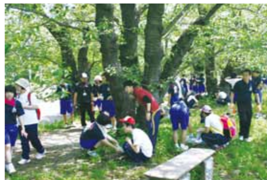
きれいな花が咲く来シーズンが、今からとても楽しみです

角館中学校2年生と大曲養護学校(せんほく分教室も含む)が体験学習として、国名勝松木内川堤桜並木(横町橋から古城橋間)のソメイヨシノの根元に肥料を与える「お礼肥」を、チャレンジデーにあわせて実施しました。 昭和63年から続くこの体験学習は、角館中学校2年生が行う活動として受け継がれ、今年で27回目。大曲養護学校も4回目の作業となりました。 教育委員会職員から作業の説明を受けたあと「来年もきれいな花を咲かせてほしい」と願いをこめて、2つの学校の生徒と一緒に桜に肥料を与える作業を行い、交流を深めました。