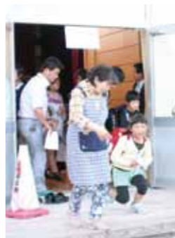
訓練を終え、保護者と帰路につく児童たち

地震避難訓練を行った生徒らは神代小学校体育館に移動し、地域別待機。学校から連絡を受けて集まった保護者を確認後、児童、生徒を引き渡して、訓練を無事終えました。 地域や保護者のご協力で、重要な確認ができた訓練となりました。