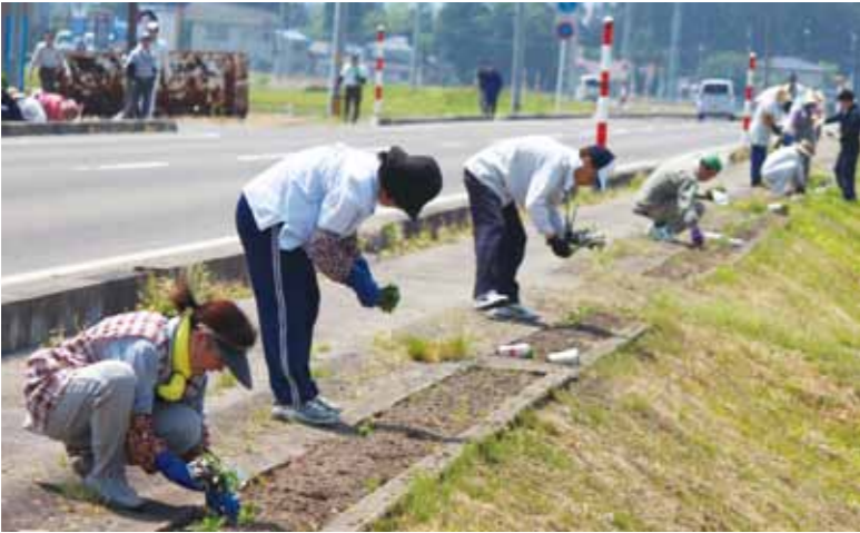
ドライバーにも親しまれているフラワーロード。植えられたマリーゴールドは、10月下旬まで楽しめます

また、この一斉植栽に併せ、花苗の販売イベント「花の市」が仙北市役所西木庁舎駐車場で開催され、大勢の人が様々な花の苗を買い求めました。