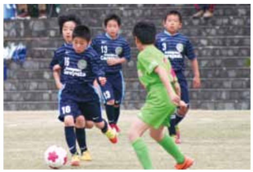
攻守が激しく入れ替わる白熱の試合展開。選手たちが懸命にフィールドを駆け抜けました

5月5日、第11回あきた南北ジュニア強化サッカー交流大会「さくらカップ」が玉川河川敷運動公園で開かれました。この大会は、秋田内陸縦貫鉄道の利用促進や、秋田県南北地域のサッカースポーツ少年団の子ども達の交流促進を目的に、春に仙北市で「さくらカップ」、秋には北秋田市で「もみじカップ」を開催しています。 大会には地元元FC角館セレジエスタと田沢湖工スベランサを含め、県南8チーム、県北4チームの全12チームが参加し、熱戦が繰り広げられました。