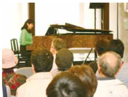
すばらしい演奏に、会場に集まった皆さんが聴き入っていました

かつて神代村小松小学校へ納められた後、長い年月が経ち廃棄寸前だったピアノ。様々な方の尽力により、きれいに生まれ変わり、今年も「奇跡のピアノコンサート」で美しい音色を皆さんに聞かせました。 コンサートは桜まつり期間中、角館町平福記念美術館を会場とし、6日間開かれました。多くの出演者が趣向を凝らした演奏で、訪れた観客の皆さんを楽しませました。