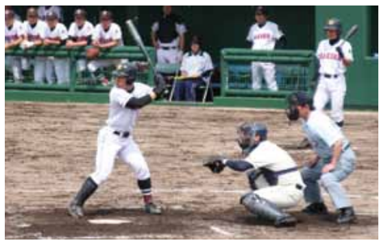
地元角館高校の試合。選手たちへ観客席から大きな声援が送られていました

平成24年から平成25年の2か年に渡り行われていた、生保内公園野球場の改修工事がこの度完成し、竣工記念試合が5月3日に行われました。 今回の工事ではメインスタンドやスコアボードが改修されたほか、グラウンド内もフェールラインの改修やクッションフェンスが設置されています。 真新しくなった野球場で、この日行われた試合は「秋田県立角館高校対岩手県立久慈工業高校」と「神代中学校対生保内中学校」の2試合。各試合とも球児たちの懸命なプレーに、集まった観客から声援が送られました。