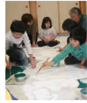
(写真上) みんなで餅つき。つきたてのお餅をほおばりました。(写真下) 紙風船に描いたゆきだるまの色塗り。