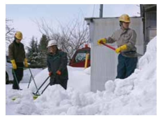
軒下にたまった雪も次々とよせられていきます。

本格的な降雪期を迎えたこの時期に、除排雪が困難な方の手助けになればと計画。当日は、20社37人が数班に分かれ活動し、スコップやスノーダンブなどで手際よく除排雪を行いました。住民からは「自分では作業をできなくなってきた。今日来てもらった本当に助かった」と感謝の声が聞かれました。