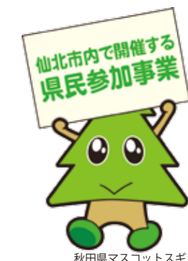
秋田県マスコットスギツチ