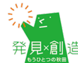
第29回国民文化祭・あきた2014

「県民参加事業」は、国民文化祭・あきた2014の開催にあたり、県民参加による盛り上げを図っていくとともに、国民文化祭以降の文化振興につなげていくため、県民が主体となって企画・提案し、実施する事業です。国民文化祭開幕前の9月から、秋田ゆかりの文化を発信する事業や秋田の偉人に光をあてた事業、分野を超えたコラボレーション、文化団体による国際交流事業などを展開します。