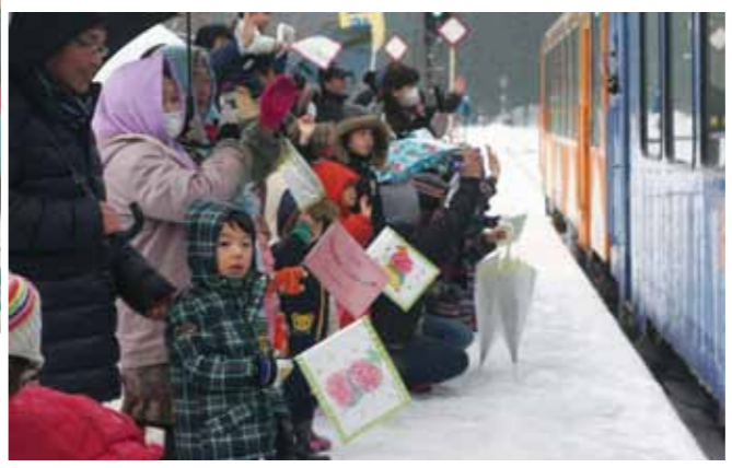
目の前を通る内陸線をお見送り。