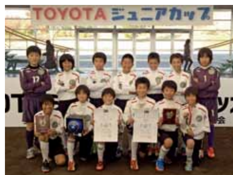
今大会（5年生以下）で好成績を収めたFC角館セレジエスタのメンバー

11月2日から4日に秋田市雄和のスカイドームで第25回トヨタジュニアカップサッカー大会が行われ、県内の各地区予選を勝ち抜いた33チームが熱戦を繰り広げました。 この大会にFC角館セレジエスタが出場。接戦を制しながら勝ち上がり、全県ベスト4の成績を収め、5月に行われる東北大会へ出場します。なお、選手の試合の様子は、11月23日午後2時からABS朝日放送でテレビ放送される予定です。