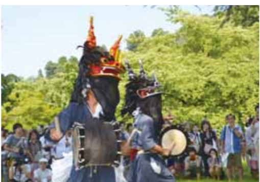
角館榊細工伝承館前広場でのささら舞(写真は広久内ささら)

勇壮な舞を披露 8月15日、白岩雲巖寺や角館榊細工伝承館前広場、立町ボケットパークでささら舞が行われ、「堂野口ささら」「広久内ささら」「白岩ささら」「白岩こどもささら」が勇壮な舞を披露しました。ささらは、佐竹家が常陸から秋田に国替えになった際に伝わり、400年以上の歴史を持つといわれています。現在は盆行事の一つとして祖霊や新仏供養、五穀豊穡を祈りスラ(舞ごと)られています。