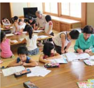
「ここで宿題を終らせたい」と熱心に勉強に取り組む子どもたち