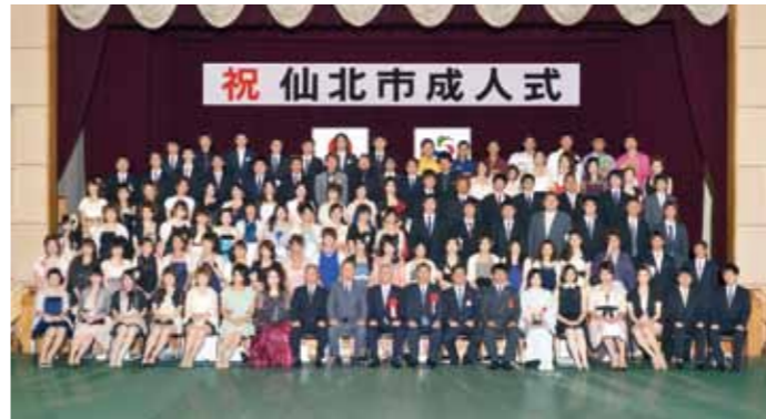
田沢湖、角館、西木地区の各出身ごとに記念撮影。写真は角館地区

新成人が誓いのことば 仙北市成人式が角館交流センターで8月15日に開催されました。今年の新成人は平成4年4月2日から平成5年4月1日までに生まれた