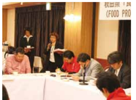
FOOD PRO あきたの総会でご当地グルメの出展について説明

現在は、会場設営のため、詳細な測量や補修箇所の確認、混雑が予想される交通・輸送関係の再確認、警察・消防署との協議のほか、交換会