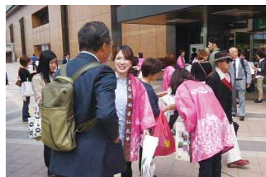
大勢の人が行き交うJR仙台駅で秋田美人の魅力とともに秋田県や仙北市をPR

秋田美人100人キャンペーン 仙台で秋田県・仙北市をPR 田沢湖・角館観光連盟は、5月16日「秋田美人100人キャンペーン」仙台キャラバンを実施しました。 JR仙台駅へデストリアンデッキで、参加した「秋田美人」36人が観光パンフレットを配り、「ぜひ秋田県・仙北市に来てください」と呼びかけました。また飾山囃子の披露やご当地キャラクターも登場し会場を盛り上げました。 キャラバン隊は、秋田県観光キャンペーン推進協議会が開催した「秋田デスティネーションキャンペーン」