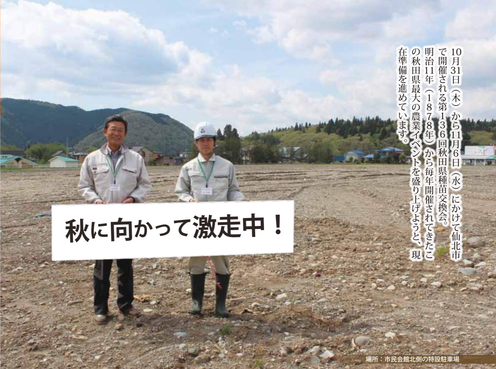
場所：市民会館北側の特設駐車場

10月31日(木)から11月6日(水)にかけて仙北市で開催される第136回秋田県種苗交換会。明治11年(1878年)から毎年開催されてきたこの秋田県最大の農業イベントを盛り上げようと、現在準備を進めています。