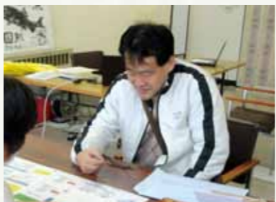
3月10日 副市長参加時の様子

位になると予測されています。海外でも、例えばアメリカでは大腸がんは、がんによる死亡原因の2位を占めています。日本人が生涯に渡り、大腸がんに罹患する割合は7%と推計されますが、人口10万人当たりの大腸がん死亡者数は、秋田県男性が何と全国トップで(女性は3位、いずれも2006年)、秋田県民であれば、10人に1人が罹患するといつても過言ではありません。