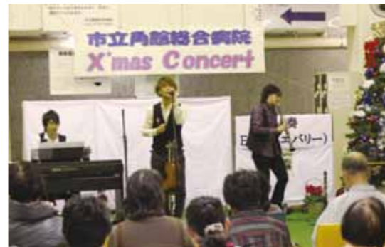
◀「ぎよしこの夜」コティズニードレシーなど演奏し会場を楽しませました。

今年は、全国各地で活躍する3人組ユニット『Everly（エバリー）』がバイオリンやクラリネット、ピアノで、クリスマスにちなんだ楽曲などを披露し、聴衆を魅了しました。