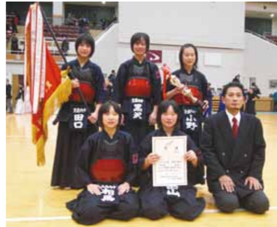
道部 ▲見事初優勝を果たした生保内中学校女子剣道部