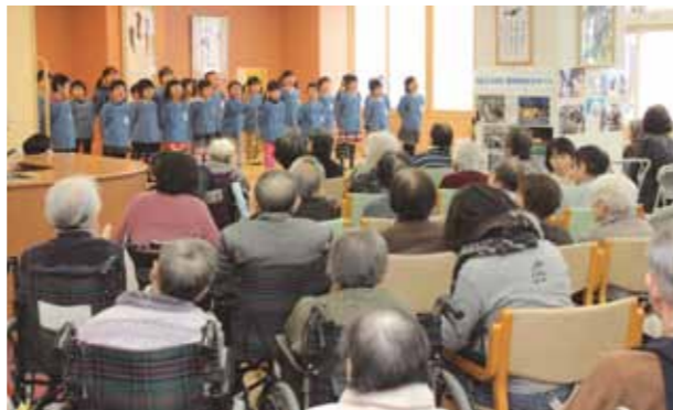
▲寒さを吹き飛ばすほど元気いっぱいの園児