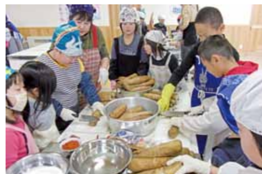
◀種まきからさまざま作業を行った児童たち。完成まであと少し。

また、今回栽培した大根のうち、いぶり大根の加工に適さないものは切り干し大根に乾燥加工し、神代子ども園の給食用に提供されました。