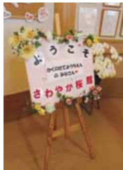
◀玄關にある園児を歓迎するメッセージ

園児たちは集まったおじいちゃん、おばあちゃん一人ひとりと握手を交わしたり、手づくりのプレゼントを交換して交流を深めました。