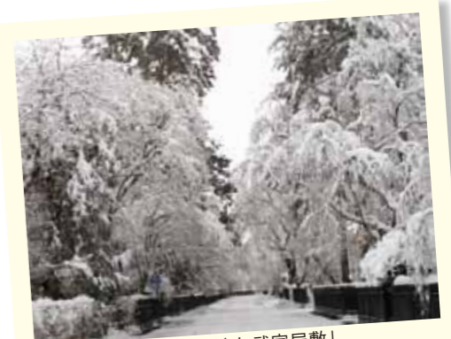
「雪景色がロケ地に好適な武家屋敷」

かくのだてフィルムコミッション (仙北市観光課内) ☎ 43-3352 http://kakunodate-fc.jp/