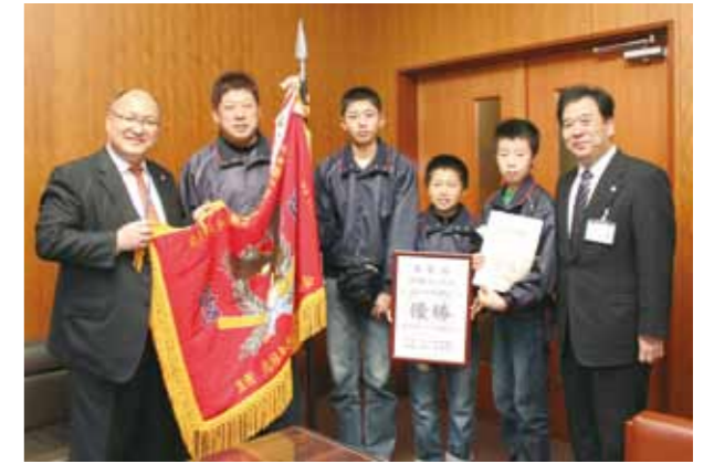
▲優勝報告に市役所を訪れた角館マックス

秋田県代表として大会に参加した角館マックスは、4試合を勝ち抜き、見事優勝を果たしました。