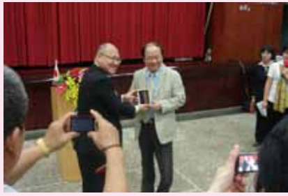
姉妹湖提携25周年を祝い記念品の交換

これに基づき、田沢湖町商工会と田沢湖町観光協会が、田沢湖国際交流促進協議会を組織し、田沢湖と澄清湖との「姉妹湖」提携を行う準備を進め、同年、澄清湖を管理する「台湾省自來水公司(当時)」を訪れ、澄清湖畔にて姉妹湖提携の調印を行い、以後、モニメントの交換や往来を伴う相互交流を重ね、日台の友好親善に寄与しています。