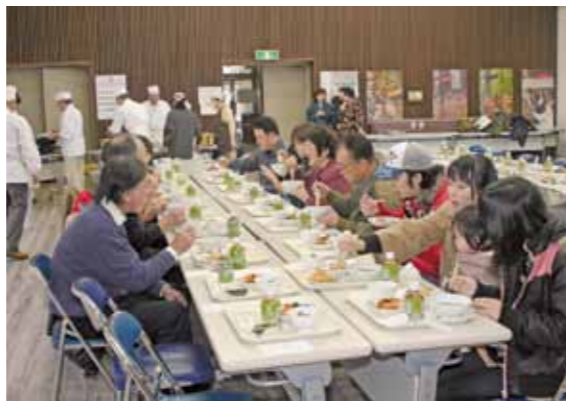
◀地元の食材を使った料理が並びました。

訪れた皆さんは、ステージ上での向生保内婦人会、田沢湖語りの会、なごみの会、石神太鼓いなほ会の皆さんによる昔語りや踊りなどを楽しみながら、山の芋鍋のほか、かき揚げや柿の白酢あえなど、心のこもったプロの料理に舌鼓を打ちました。