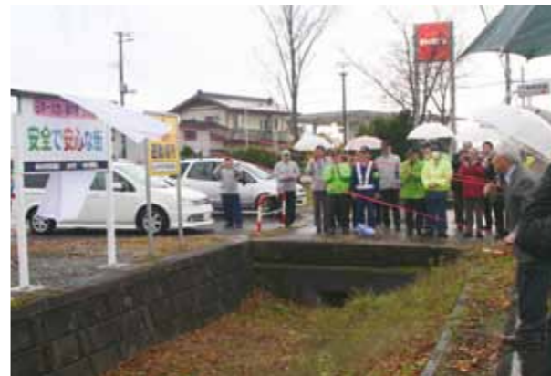
▲西木地域に設置された防犯看板の除幕式

西木地区の看板には「日本一大きな栗の里 西木町安全で安心な街」と書かれ、各地域の特色を看板にそれぞれ盛り込み、啓発への工夫を凝らしています。