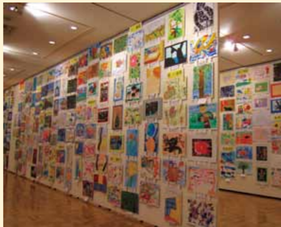
写真は今回展示している作品