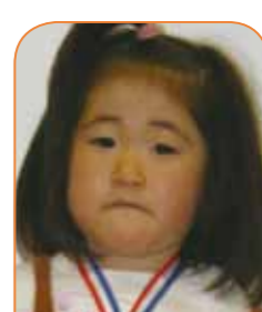
とみおか あさひ とみおか あさひ