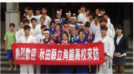
盛大な歓迎を受けた交流会

埔里鎮、高雄市と3つの高校を訪れ、郷土伝統芸能である飾山囃子を披露し、各学校の生徒たちと交流を図りました。中でも台北市立士林高級商業職業学校(生徒24人)は、11月18日から20日まで修学旅行で仙北市を訪れ、両校の生徒はさらに交流を深めました。また、台北市と高雄市で観光宣伝会を開催し、多数の旅行社やマスコミ関係者が集まり、秋田県や仙北市の観光などを幅広く宣伝しました。