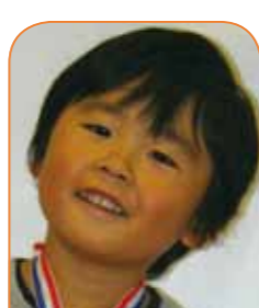
はがわ こはく 羽川 琥