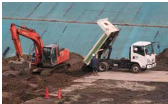
単位：マイクロベクトル/時

プラスチック類が混じった土類。処理場へ到着したトラックは、場内で市職員による放射線量の測定がされ、空間放射線量の確認が行われたあと処分されました。この日運び込まれた量はおよそ24ト。以降は土・日曜日、祝日を除く平日におよそ25ト程度を、1日当たり処理していく予定です。 市では、向生保内地区連絡協議会との協力のもと、安全・安心な受入れに万全を期していきます。ご理解、ご協力をよろしくお願いいたします。