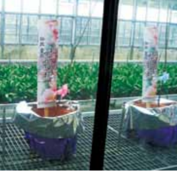
仙北市から贈られた桜の苗木