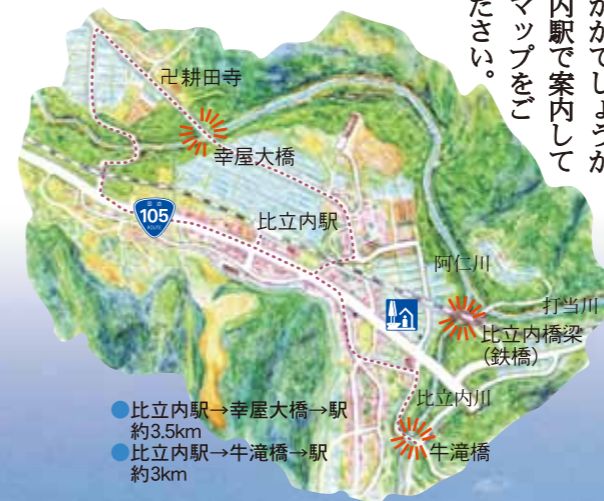
● 比立内駅→幸屋大橋→駅 約3.5km ● 比立内駅→牛滝橋→駅 約3km

角館から約1時間で着く旧阿仁合線の終点だった比立内。この辺りは一見平坦地が広がる山村ですが、深い谷を阿仁川が流れています。駅の手前の鉄橋は阿仁川支流の比立内川の谷間をまたいで架かり、車窓からの眺めは絶景(下の写真)。すぐ下流で打当川と合流し阿仁川となる溪谷美、徐行運転で乗客を楽しませてくれます。 また、川面より36Mの高さに架かる幸屋大橋から眺める阿仁川渓流も素晴らしく、さらに牛滝橋もオススメ。散策コースになっていますのでウォーキングにいかがでしょうか。 比立内駅で案内しているマップをご覧ください。