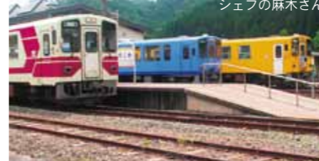
左: 阿仁合駅ホーム 右: 阿仁合駅前には韓国映画「アイリス」の大きなパネルが設置されています