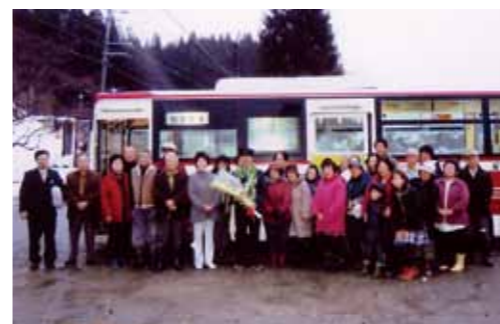
写真上から上鎌川停留所、西木公民館停留所、松葉車庫前