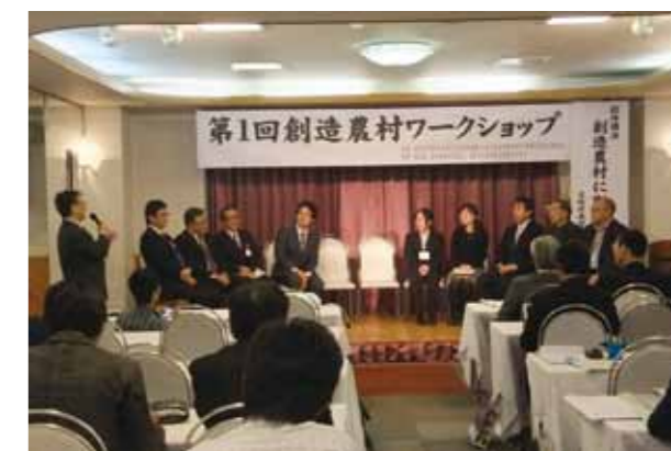
たざわこ芸術村で開催され、全国から10を超える地域、約90人が参加した第1回創造農村ワークショップ

行政・企業・市民団体・報道機関などが一体となり、江戸時代からの歴史的町並み、豊かな文化・観光資源、たざわこ芸術村の展開を連携させ、交流人口の更なる増加や文化芸術に携わる雇用の創出を企図した「田園型・創造都市（創造農村）」づくりに取り組んでいることが評価されました。