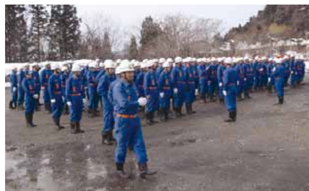
角館地区で行われた駆け付け訓練

今年は雪融けが遅く、まだまだ暖房器具を使うと思いますが、火の取扱いには十分ご注意ください。