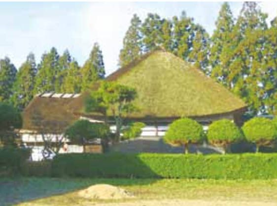
建築物部門「小田嶋家住宅」 田沢湖小松字二枚橋