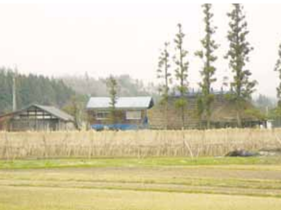
景観保全部門「佐藤家の風はじき」 西木町門屋字屋敷田

2月23日、市役所田沢湖庁舎で平成22年度の「仙北市ふるさと景観賞」の表彰式が行われました。建築物部門で「小