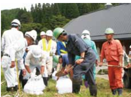
各種工法に取り組み参加者

午後は角館消防署・西木分署員の皆さんによる救急講習で、心肺蘇生法、AEDの使用方法などを学び、災害時の体制や技術の向上に努めました。