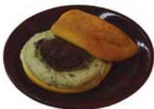
「大栗ふわり」 プチ・フリーズ