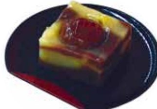
「西明寺栗入り蒸し羊羹」 ゆかり堂製菓(有) 駅通り店