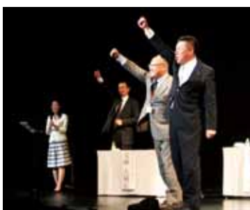
知事が音頭を取り、会場みんなで「秋田を元気に」

仙北市を元気にしようと呼びかけている人たちの話に、会場に詰めかけた約400人の参加者は熱心に聞き入っていました。