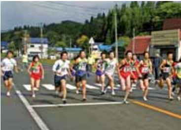
「スポーツ」の秋 10月10日(日)には、西木町で 駅伝大会が開催されます。

秋です。近所で稲刈りが始まり ました。農家の皆さんも忙しそ うです。この号が皆さんに届く頃 は、忙しさも一段落する頃では しょうか？今号には、秋の情報 がたくさん掲載されています。「ど れどれ？」と新しい広報を手 に取りながら、一息入れてくだ さい。(一一) 今号の編集を 始めた頃は、残暑が厳しいと思 っていましたが、出来上がるこ ろには少し肌寒くなり、秋が感 じられるようになりました。秋 と言えば、「スポーツ」「読書」 「食欲」。大好きな季節がやっ てきました。(88) 9月はイ ベント盛りだくさんで、広報担 当にとっては、大忙しの月でし た。10月は少し落ち着いて、自 分の時間がとれるかなと思っ ていますが、どうなることか ……。それにしても表紙の栗 ご飯、おいしそうですね。皆 さんもぜひご賞味ください。(☆ ☆)