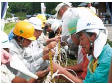
まずは基本のロープ結び