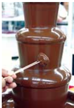
「オークリ」 唐土庵さくら並木店

9月22日、角館プラザで西木町特産品「西明寺栗」を使った料理やお菓子の発表会が開かれました。会場には30品を超える料理やお菓子が並び大勢の来場者で賑わいました。 地元特産品を活用し「名物」とと、昨年に引き続き、横町さくら通り会と仙北市商工会が開催した発表会には、加盟の15店舗から工夫を凝らした創作料理とお菓子がお披露目されました。 また、栗ご飯の試食コーナーもあり、訪れた人たちは、秋の味覚を楽しみながら、お菓子を買い求めていました。