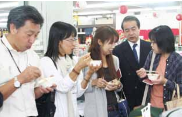
「栗ご飯」の試食コーナー

西明寺栗、まいたけ、比内地鶏を使用した栗ご飯のほか、栗料理は、「郷土料理百穂苑」「月の葉」「和食処藤八堂」「角館しちべえ」「プチ・フリーズ」「居酒屋なるほど」「料亭登喜和」「源八」「料亭稲穂」「日本料理まる松」で食べることができます。