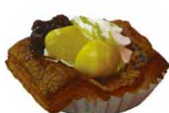
「西明寺栗デニッシュ」 ルーシーカンパニー