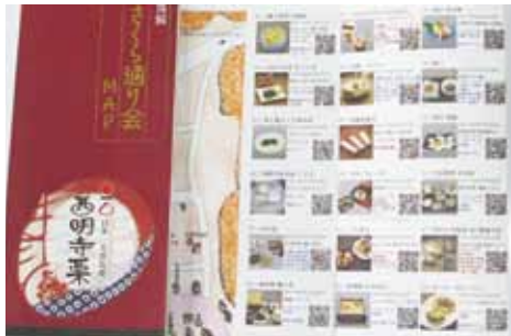
店舗や料理の情報など検索できるQRコード付きのパンフレットも作製

9月22日、角館プラザで西木町特産品「西明寺栗」を使った料理やお菓子の発表会が開かれました。会場には30品を超える料理やお菓子が並び大勢の来場者で賑わいました。 地元特産品を活用し「名物」とと、昨年に引き続き、横町さくら通り会と仙北市商工会が開催した発表会には、加盟の15店舗から工夫を凝らした創作料理とお菓子がお披露目されました。 また、栗ご飯の試食コーナーもあり、訪れた人たちは、秋の味覚を楽しみながら、お菓子を買い求めていました。