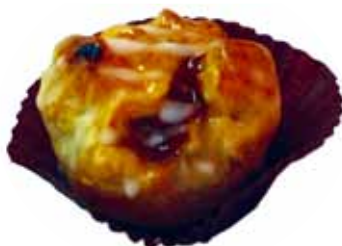
「マロンパイ」 くろまる