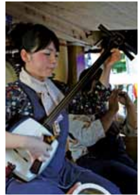
若いメンバーが伝統を受け継いでいきます。

次の世代に伝えていきたい とベテラン勢は話します。 8日に行われる「おやま 囃子コンクール」ではこれ まで優秀賞を2回受賞して います。 駅通り丁内の皆さんとは お祭り期間以外にも親交が あり、曳き手と囃子という 関係を越えた関係を築いて います。角館のお祭りによっ て結ばれた縁。これからも 大切にしていきたいです。