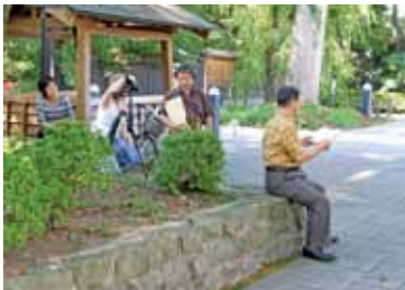
学習資料館前での撮影風景

暑かった今年の夏もようやく終わり、朝夕過ごしやすくなってきました。いよいよ読書の秋です。17日から始まる「芥川龍之介」展にぜひお出かけください。展示資料のリストを見ると、ここでしか見られないような貴重な資料がいっぱいでした。今年が「国民読書年」ということを知らなかった私でも、興味ある内容です。(☆☆) 今年度広報担当になり半年が経ちました。十数年ぶり2回目の担当です。昔と違いカメラはデジタルに、原稿用紙はパソコンで、パソコンの中で広報ができていきます。スイスイとはいきませんが……。前回からの広報リニューアルどうでしょうか。みなさんに楽しみにしてもらえる広報を。ご意見お聞かせください。(ー) 今号の表紙は、読書の秋をイメージし、学習資料館前で撮影しました。最近の本を読むことがだいぶ減ってしまいましたが、今年は「国民読書年」。最低1冊は読みたいと思います。(☎)