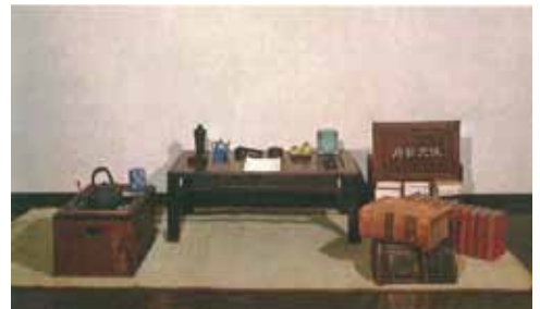
漱石夫人より贈られた文机

開館時間： 9：00～17：00（入館は16：30まで） 観覧料： 3館共通券 大人（高校生以上）720円 小人（小中学生）360円（単独券、団体割引あり）