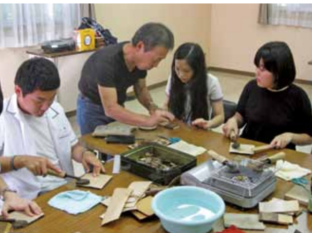
説明を聞きながら熱心に作業

秋田市の秋田北高校と姉妹校提携をしている韓国高陽市の花水 ふあす 高校の生徒21人が本市を訪れ、樺細工制作体験を行いました。一行は4日間の日程で本県を訪れているもので、この日は午後3時から樺細工伝承館で3班に分かれ、樺細工製作者協会のみなさんによる指導のもと、樺細工コースターづくりを体験しました。