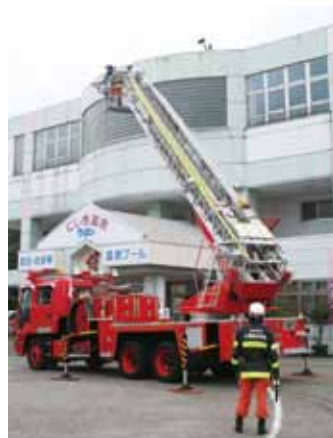
はしご車での高所救助訓練

花水高校一行は昨年も本市を訪れ樺細工制作体験を行っており、今後も文化を通じて本市のことを知っていただく機会づくりを提供していきたいと考えています。