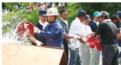
真剣な眼差しで訓練臨む