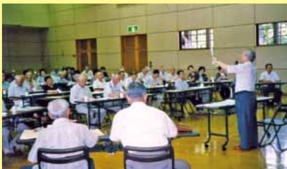
訪問活動に関する研修会の様子