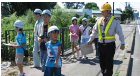
道路を守るパトロール

8月5日、角館小学校の児童7名が参加し「小学生道路パトロール体験会」が開催されました。これは「道路ふれあい月間」の行事として、国土交通省角館国道維持出張所が行ったものです。