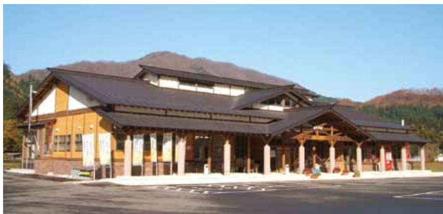
仙北市活性化施設 「かたくり館」

市では、これまで「仙北市活性化施設（かたくり館）」の管理業務について、指定管理者制度を導入し、市民サービスの向上や経費削減等に努めています。この度、現行の指定管理者の指定期間が平成22年度をもって満了するため、「仙北市活性化施設（かたくり館）」の指定管理者を募集します。指定管理者は、市が設置する選定委員会での応募者の審査結果を踏まえて市長が候補者を決定し、議会の議決を経て正式に決定となります。