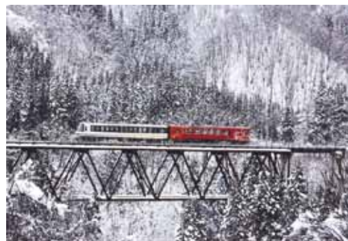
最優秀賞「乗って残そう内陸線」