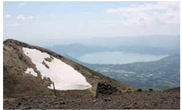
男女岳から見た、男岳と田沢湖