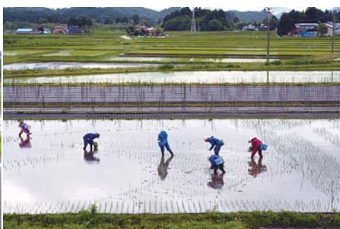
仙北市の市章の植え付け作業状況