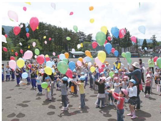
1・2年生、園児による交通安全風船上げ