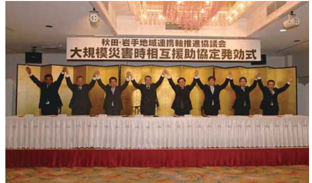
協定締結を祝い硬く手を取り合う市長ら

協定は、大規模災害発生時に、◇食料、飲料水などの生活必需品の提供◇救援車両の提供◇被災者の救出、医療、防疫などに必要な資機材の提供◇被災者の一時入所施設の提供◇応急復旧に必要な職員の派遣などを相互に援助するとしている他、きわめて甚大な被害で、通信途絶等により被災自治体と連絡が取れない場合でも、被災自治体以外の構成自治体相互が連絡調整し、自主的に援助活動に乗り出すこととしています。