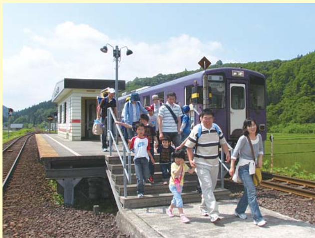
内陸線を利用して“ゆさんこ号”に参加

仙北市を南北に貫く秋田内陸線が、沿線地域の日々の暮らしを支えている生命線であることは間違いありません。特に、少子高齢化が過疎化に拍車をかけている現状にあっては、健康な地域づくりを進めるうえでも内陸線は必要な存在であり、存続は社会保障の一環として捉えることができるのではないのでしょうか。