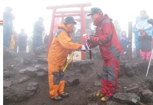
雫石町とのピッケル交換

山頂では、岩手県側から登ってきた雫石町の皆さんと合流し、両市町合同で交歓会を実施。ピッケル交換を行うなどして、夏山シーズンの到来を喜び合いました。