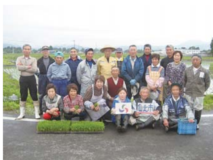
参加した皆さんで記念撮影