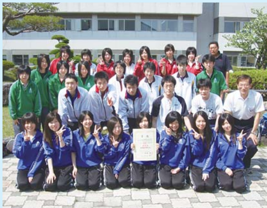
女子団体が東北大会出場を決めた卓球部

今年の卓球の東北大会は地元開催ということで、東北大会への出場枠が増えていました。これは私たちが東北大会へ出場するための最大のチャンスであり、3年生にとっては最後のチャンスでもありました。部員一人ひとりが「絶対に負けたくない」という気持ちを持ち、毎日練習に取り組み、全県総体に挑みました。その結果、全県総体ではみんなの気持ちが一つになり、厳しい接戦を乗り越え東北大会の団体出場件を得ることができました。その瞬間みんなで喜び合い、今まで頑張ってきた本当に良かったと思いました。指導してくれた先生、コーチ、OBの先輩方、いつも支えてくれた先生方、家族、友達、たくさんの方々の力があってこそできたことだと思います。