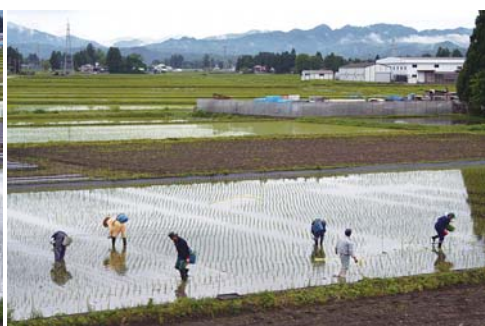
仙北市の字体の作付状況