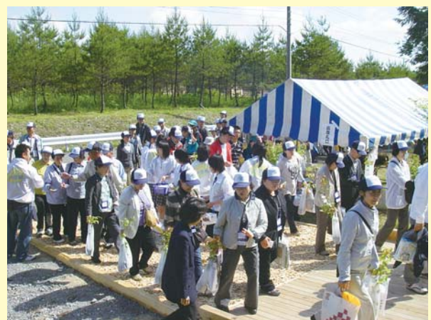
高校生が植樹祭参加者に内陸線への応援を呼びかけました (北秋田市大野台駅にて)

私たち守る会は、内陸線を貴重な社会資本として位置づけ、様々な機会の中で存続に向けた活動を実践しながら存続の機運を盛り上げていきたいと考えております。