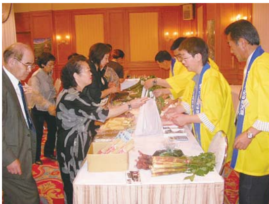
会場に設けられた特産品即売コーナー。山菜、おやきなど大人気で、懇親会終了前に完売しました。

引き続き行われた懇親会では、神代産米の特別純米酒が振る舞われ、会員による民謡ショーや抽選会などで盛り上がりながら、故郷の昔話やお互いの近況報告し、終始和やかな雰囲気での楽しい時間を過ごしました。