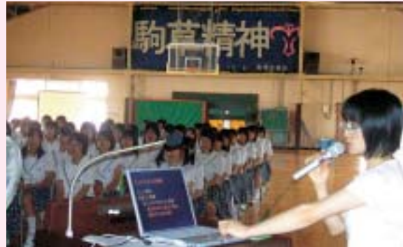
7月11日に行われた性教育講座

本校の情報はホームページで! http://www.hana.or.jp/buna/kakunan/