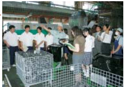
企業の担当者から説明を受ける高校生

引き続き、3つの班に分かれて、各3社の企業を訪れました。訪問先の企業では、初めに会社の概要について説明を受けたあと、会社内を案内してもらい、仕事の内容を熱心に見学していました。