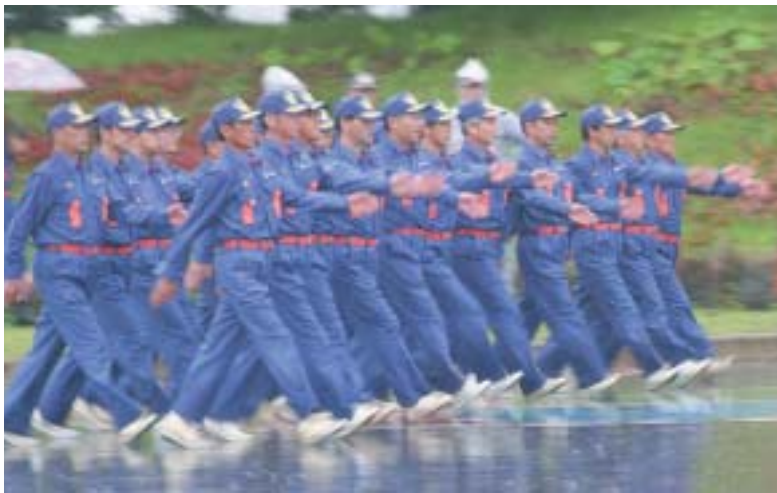
規律訓練の部で優勝した角館消防団第2小隊の一行乱れぬ行進

仙北市消防訓練大会が7月2日、サンビレッジ角館落合球場駐車場を会場に開催されました。