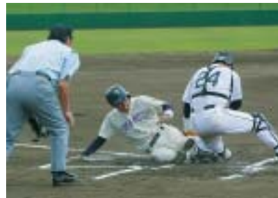
リードを許した鷹巣の反撃開始

大会(成年)の結果は、鷹巣野球クラブが接戦の末、高清水野球クラブを6対5で下し優勝を飾りました。