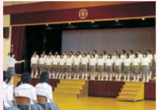
6月20日に行われた校内合唱コンクール

平成18年度の校内合唱コンクールが6月20日に行われました。長い伝統を持つ合唱コンクールは、合唱を通じて情操を豊かにすること。また、心をひとつにして思いを込め、美しいハーモニーを奏することで各クラスの団結を深めることも狙いとしています。今年の課題曲は「Tomorrow」。5月下旬から練習の歌声が朝と昼休み、放課後に校内のあちこちから聞こえ始め、次第に練習にも熱が入っていきました。当日は「みんなの登校日」として保護者や地元の方たちも来校し、「3年最後の合唱コンクールであり、感無量でした。今日を迎えるまでの娘の一生懸命頑張っている姿、晴れ舞台に胸が熱くなりました」との御感想をいただきました。最優秀のクラスは10月4日に行われる「地域との交流会」で発表いたします。