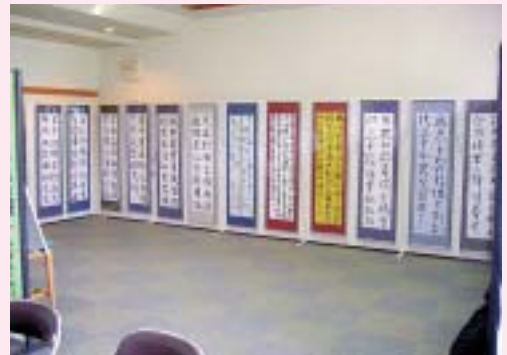
6月23日から3日間展示された角南書道展

6月23日~6月25日の3日間、広域交流センターで角南書道展が開催されました。平成元年が第1回ということで今年は第18回の開催になりました。書道展には205名の方に足を運んでいただき、生徒たちに励ましの言葉をたくさん頂きました。本当にありがとうございました。作品の一部は、その後7月19日まで大仙市長野の道の駅【こめこめプラザ】に展示され、途中立ち寄られた方の目や心を楽しませました。