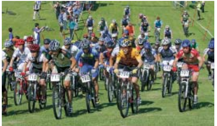
クラス別にスタートし、ゴールを目指す選手たち

例年行われているダウンヒル競技は、たざわ湖スキー場改修工事のため、中止しました。