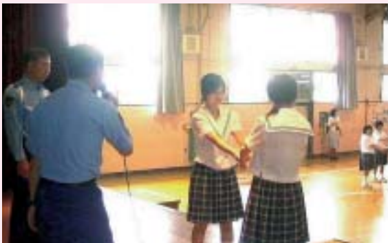
7月4日、護身術を教えていただいています

これらの行事を振り返ってみると、地元の方や地域社会のご協力、ご支援のもとで生徒たちは育っているということです。そのことを生徒たちも理解し感謝しております。生徒の社会性の育成の観点からも、これからもいろいろな場面でのご協力、ご支援をお願いいたします。