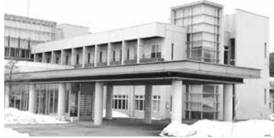
■診療所化される市立田沢湖病院

⑥病院の存続を第一に考え、改善が見込まれない場合は、給与費の抑制に踏み込まざるを得ない。