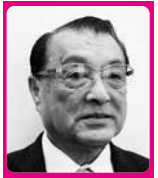
公明党 熊谷 一夫 議員