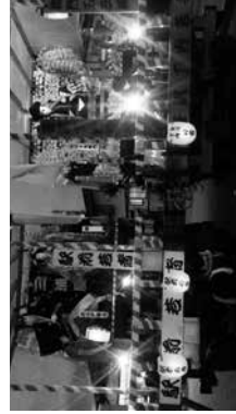
■曳山展示などでの誘客も期待されるお祭り会館

答弁 活用できる財源確保について本気で模索し、実現については、可能性を何とか検討していきたいと考えている。