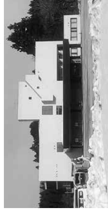
■スマートシユリンクによる施設の統廃合（上野庁舎）

こうした見直しは削ることだけが目的ではなく、守るべき機能は守り抜き、重点分野に資源を振り向けることで結果として、市民の安心と暮らしの質を高めることを目指す。