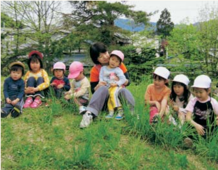
少子化子育て支援の充実

質問 市三役、教育長、議員の給与、報酬等の引き上げについて、市議会では修正案も出されて、結果は原案の通り可決された。私自身、色々な集会に行くところ、その場所場所で議員の報酬の事が話題となる。その会合の本来の事をさしおいて引き上げの事が話題となる。