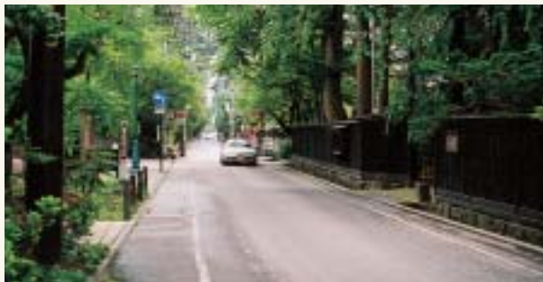
流水が待たれる田町付近