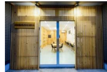
仙北市グローバル雇用・創業ワンストップセンター