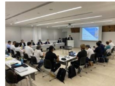
説明会のイメージ