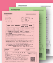
各種健(検)診受診券