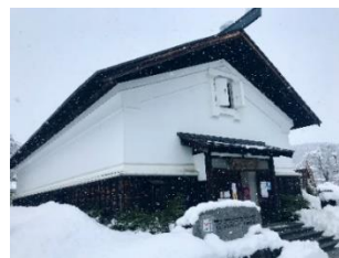
仙北市観光情報センター「角館駅前蔵」