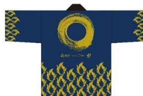
特別体験専用の法被