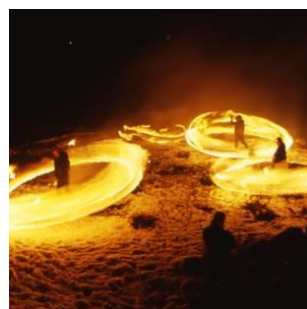
角館の火振りかまくら