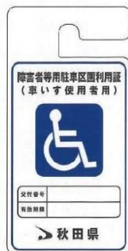
車いす使用者用(青)