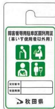
車いす使用者以外用(緑)