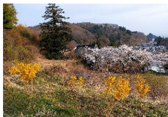
4月21日撮影 桜とレンギョウの コラボレーション